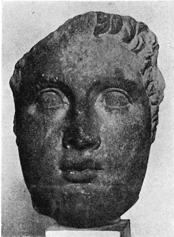
Fig. 3. Hoved fra Pergamon (i Berlin).

Der vilde intet være i Vejen for at opfatte Glyptotekets Hoved som et Privatportræt, hvis der ikke eksisterede en Replik, et Marmorhoved af den samme Personlighed i yngre Alder, fundet i Pergamon i et lille Tempel, hvor det aabenbart har hørt til Tempelbilledet selv; noget saadant: en Fyrsteportrætstatue som Gudebilled, var ikke ualmindeligt i den hellenistiske Periode, saaledes at Fyrsterne enten selv var Indehavere af Templet eller en anden Guds „Medboere“. Ogsaa af det pergameniske Portræt er kun Masken bevaret (Fig. 3—4) 4 ; man genkender den vigende Pande, den fede Dobbeltthage, de dybtliggende Øjne, men især den ejendommelige Næse. At det er den samme Personlighed med yngre, mindre markerede, mere afrundede Træk, lærer især Betragtningen af Originalerne; i Reproduktion skuffer og ændrer Retoucher og Skygger en Del.