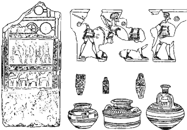
FIG. 2. — Stèle de Mycènes; Vase des Guerriers de Mycènes; objets en verre et vases communs découverts avec la stèle.

peinture, appliquée sur une couche de chaux de 0 m ,003 d'épaisseur, on distingue des ornements circulaires et rectilignes incisés, d'un type jusqu'à présent nouveau (1). Il est donc certain que cette plaque a servi plusieurs fois; d'abord, elle a reçu des ornements gravés; puis, elle a été couverte de chaux afin d'être peinte; enfin, alors qu'elle était déjà mutilée dans le haut et endommagée ailleurs, on l'a employée comme une simple tuile pour boucher l'entrée d'une sépulture très modeste. Or, il est essentiel de remarquer que cette sépulture modeste est l'annexe d'une sépulture circulaire plus grande, où l'on a trouvé des objets mycéniens parfaitement carac-