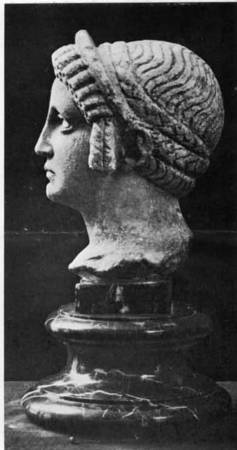
TÊTE DE FEMME ROMAINE, DE MARTIGNY.