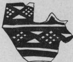
Fig. 171. — Céramique peinte, Sakdjé-Geuzu.

Dans le soi-disant later neolithic il faudra, quand le nombre des tessons sera plus considérable, établir des comparaisons avec les découvertes de Palestine : le résultat peut être très important. Déjà M. Garstang signale certains spécimens d'argile brune à surface jaune avec décor géométrique posé en noir (fig. 171) ressemblant à la céramique trouvée par M. de Morgan à Suse, à un niveau qu'il attribue au temps de Naramsin c'est-à-dire, d'après la chronologie établie aujourd'hui, vers 2750 (et non 3750 comme on le croyait). A cette époque, les Cananéens ont pénétré en Syrie depuis deux ou trois siècles et nous savons qu'ils ont peu à peu pris la place des néolithiques. Comme ils venaient — sans qu'on puisse préciser davantage — d'une région opposée à la Méditerranée, il ne serait pas surprenant qu'ils aient importé une céramique du type de celle qu'on retrouve en Élam. Nos lecteurs savent que M. J. de Morgan 2 a déjà émis l'hypothèse, bien près de se vérifier, d'un transport vers l'ouest de cette céramique élamite et qu'il y cherchait — ce qui demande encore confirmation — l'ori-