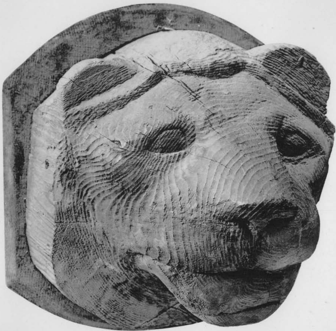
Prototypie Berthaud Paris