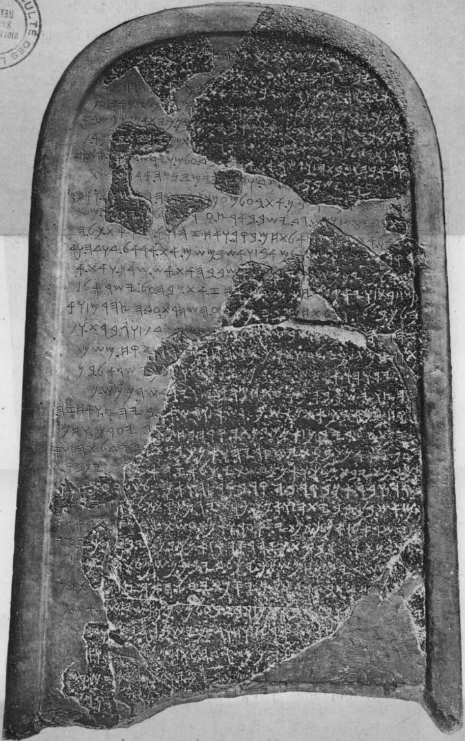
STÈLE DE MESA