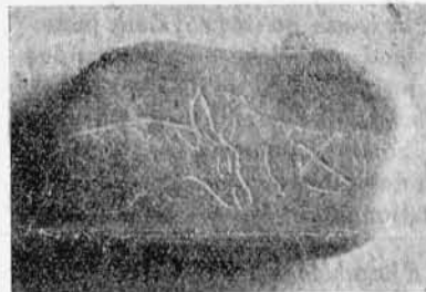
Fig. 3. — Galet gravé avec représentation animale et signes alphabétiques.

réales quand le climat tempéré de la période néolithique a succédé au froid sec des temps magdaléniens. MM. Morlet et Fradin en concluent que la gravure de ce renne, ainsi que les trois signes alphabétiques qui l'accompagnent, remontent au début du néolithique. Or, des caractères analogues se retrouvent sur des tablettes d'argile dont plusieurs ont subi l'action du feu et sur des