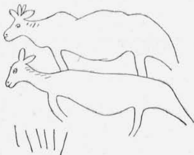
Fig. 1. — Représentation animale sur galet.

Pierre à signes alphabétiques ou à gravures d'animaux, des briques à signes alphabétiques, des empreintes de main, de nombreux débris de poterie. Ces fouilles ont été continuées en collaboration avec notre distingué confrère, M. A. Morlet, de Vichy, qui a consacré trois fascicules à reproduire les photographies d'un certain nombre de pièces trouvées et à discuter les diverses opinions qu'on peut émettre soit sur la chronologie, soit sur la nature des signes constatés sur les briques et sur les outils de pierre ou les galets.