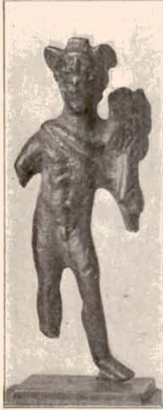
2. HERMES-THOTH. (Term. nagys.)

bronz szellemtelen, otromba kifejezése. A hajviselet is eltér a Ligurio szobor elől homlokba fésült, hátul fölcsavart hajviseletétől. A mi bronzszobrocskánk közelebb áll Polykletos művészi köréhez. A nyugodtan álló alaknak teljesen kifejlett, érett formái megoldását csodáljuk rajta. Mintegy közbeeső helyet foglal el a Hageladas-féle szobrocská s a gyönyörű párisi görög bronz között, mely Polykletos művészi szellemét a maga egész teljességében mutatja be. 1 — Tárgyi érdekességet az ad szobrocskánknak, hogy nem