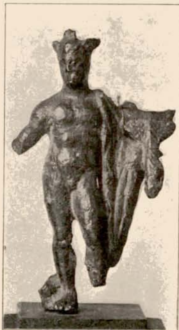
3—4. HERMES-THOTH. (Term. nagys.)

Die Statuetten werden in den Öst. Akten eingehend besprochen.