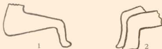
Obr. 9. Sedící idoly z Moravy. (1 Střelice u Znojma, 2 Jaroměřice u Mor. Budějovic.) Fig. 9. Idoles assises de Moravie. (1 Střelice, près de Znojmo, 2 Jaroměřice, près de Moravské Budějovice.) Zemské mus. v Brně.

sedící sošky vzácností, ale přes to jejich počet proti soškám stojícím je malý. Zůstává otázkou, zda menší jejich rozšíření je důsledkem nedostatku tvůrčí schopnosti, kterou nutně hotovení těchto složitých a naturalistických sošek vyžadovalo, či zda závisí jen od šíření určitých náboženských představ nebo kultu. Toto bude asi pro otázku nejvýznamnější. Jinak ovšem naturalistické sedící idoly zůstaly výjimkami mezi množstvím