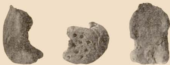
Obr. 8. Sedící idol z Komořan (Kommern). Fig. 8. Idole assise de Komořany (Kommern), près de Most (Brüx). Museum Teplice.

Druhý sedící idol byl nalezen již před léty v Komořanech (Kommern) u Mostu 11 a je