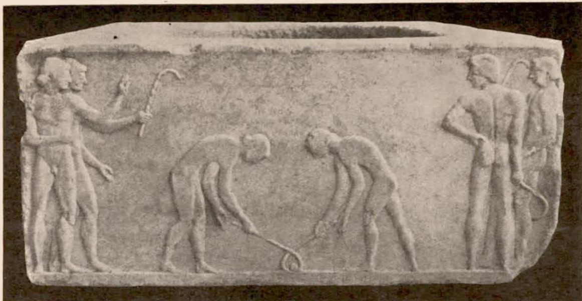
Ἐθνικοῦ Μουσείου ἀριθ. 3477. Νεαροὶ Ἀθηναῖοι κερητιζόντες.