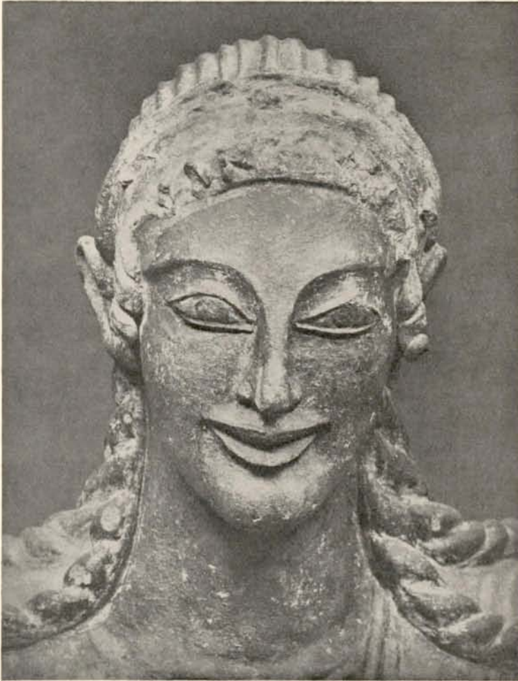
Fig. 4. Hovedet af Statuen Fig. 3.

Ryggen og tre Skulderfletninger paa hver Side af Halsen. Man vil i alt dette se store Ligheder med Figurerne fra Veji.