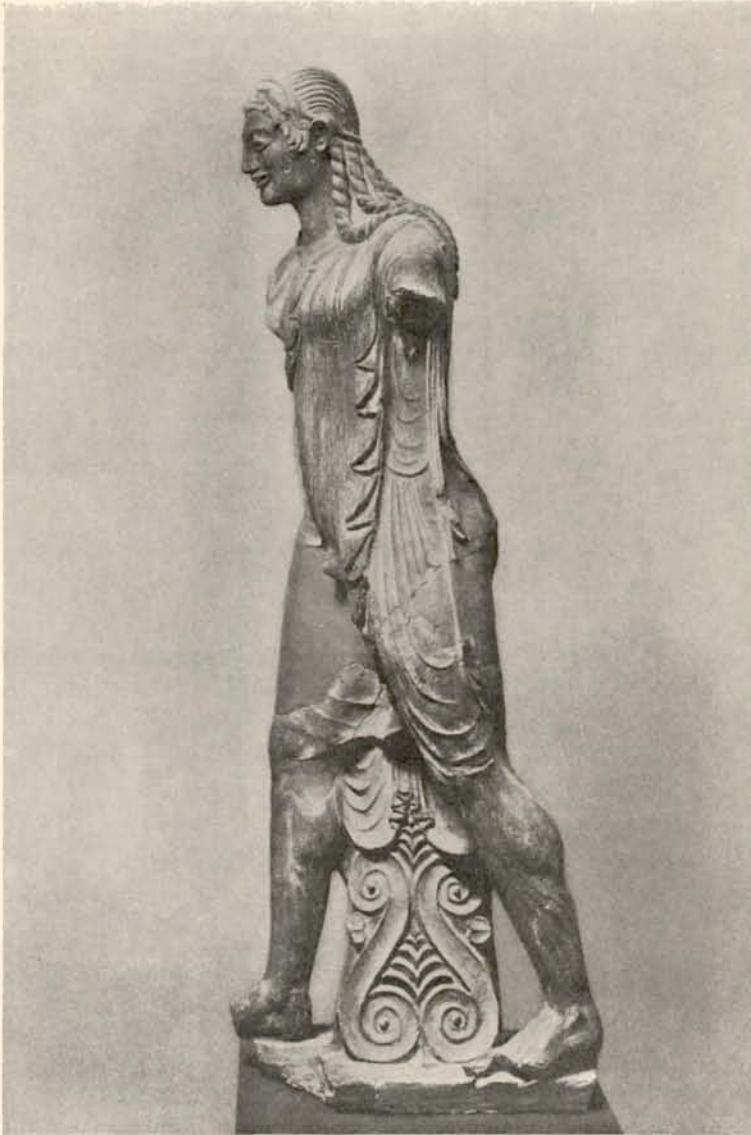
Fig. 3. Apollonstatue fra Veji. Villa Papa Giulio. Rom.

grænset til færre Materialer, de anvendte ikke Marmoret; thi først langt senere, paa Kejser Augustus' Tid, opdagedes og udnyttedes Marmorbruddene i Carrara. Men Bronzen forstod de at støbe, og Terrakottastatuen i naturlig og overnaturlig Størrelse,