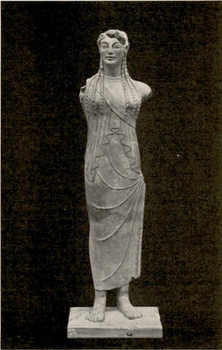
Fig. 5. Etruskisk Kvindefigur. Ny Carlsberg Glyptotek.

piler i de mandelformede, lidt skraa Øjne, og Rester af sort Bemaling viser sig ogsaa i Rillerne mellem Haarets Perlelokke. Sorte brede og smalle Bræmmer finder vi langs Chitons øvre Søm og langs den nederste Rand samt under Ærmegabene, hvor to og