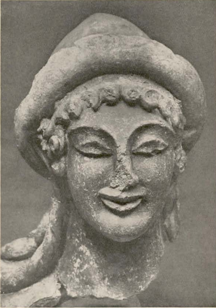
Fig. 1. Hermes fra Veji. Villa Papa Giulio. Rom.

ning, ses af Datidens Holdning. Fønikerne slaas ud af de græske Handelsflaader, deres Kunstvarer er usælgelige, selv det sejrige Persien efterligner græsk Arkitektur og Skulptur, og Kroisos synes os helt græsk trods sin orientalske Rigdom. Hvad han skænker til helleniske Templer, er i hvert Fald altid forarbejdet af Hellas' egne Guldsmede eller Bygningshaandværkere.