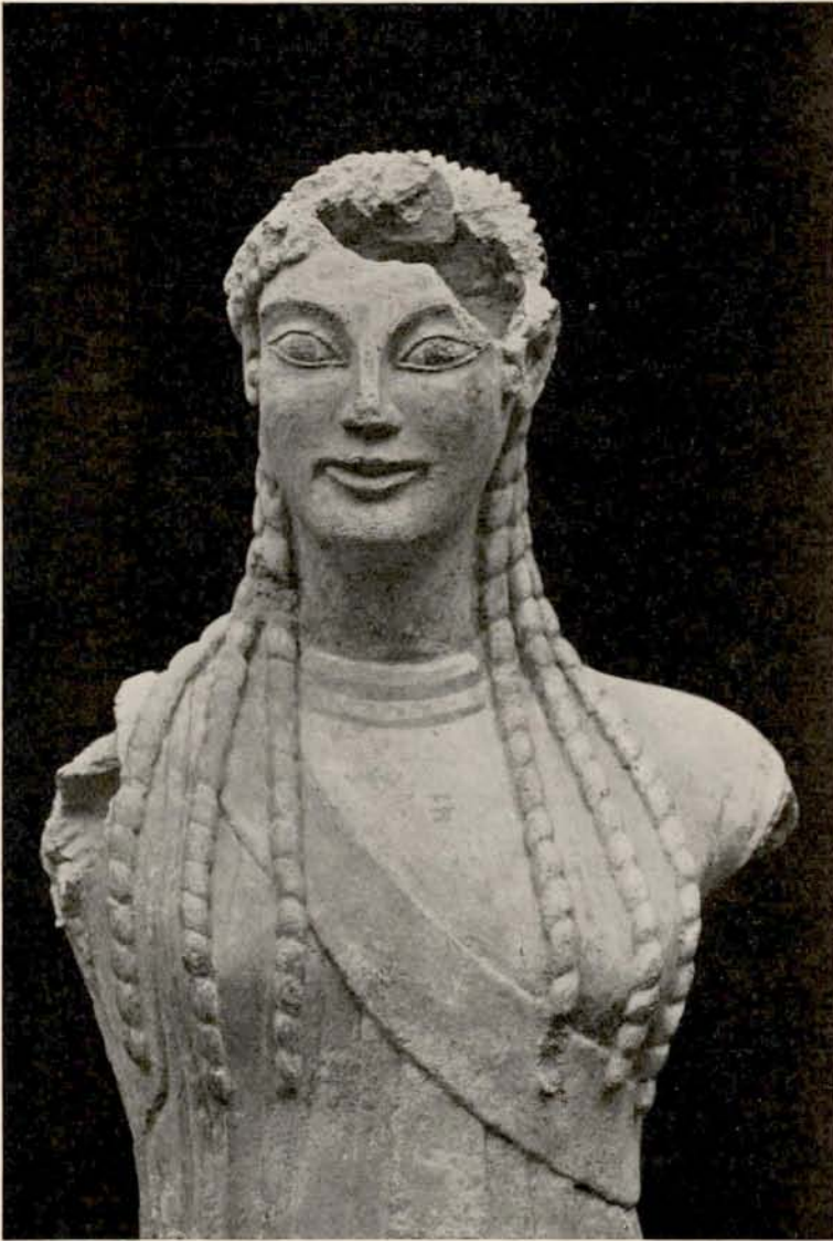
Fig. 6. Øverste Parti af Glyptotekets Kvindefigur.

om den ægformede ioniske Hovedskal, men Panden er mindre skraa, mere rejst, saaledes at man tænker paa Attikas Korer. I Kendskab til Legemsformerne under Dragten naar den etruskiske Kunstner naturligvis ikke de samtidige attiske Billedhuggere, og Skridtstillingen har, selv om vi regner med en rigtigere Indstil-