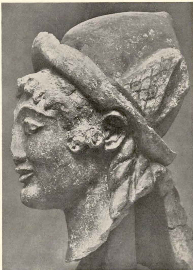
Fig. 2. Profil af Hovedet Fig. 1.

Af Artemis er derimod kun ubetydelige Rester fundet. Hermes (Fig. 1—2) bærer den spidse Filthat med opbræmmed Rand, Bønder og rejsende i Oldtiden brugte, og som derfor tilkommer den lynsnare Budbringer fra Zeus, og under Hatten, der er forsynet med Vinger og er rød med gult Foer, vælder Pandeløkkerne frem, stiliserede i Spiraler, mens Nakkehaarets lange Fletninger spre-