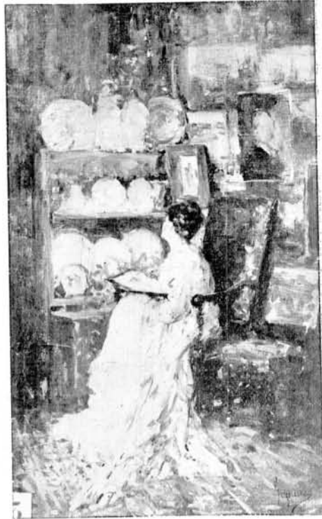
Colț de atelier. — Colecția A. Vlahuță.

cunoaște îngrădiri de timp și loc. Deși creațiunile sale înfățișează în marcelor majoritate subiecte curat naționale, opera sa întregă însă are un caracter așa de individual, de bine hotărît, se desprinde așa de vădit chiar de genurile similare ale maeștrilor streini, încât formează un tot aparte, de sine stătător, fără premergători direcți și probabil fără urmași. Numele lui Grigorescu inaugurează în mod strălucit istoria picturii românești, și chiar în analele universale