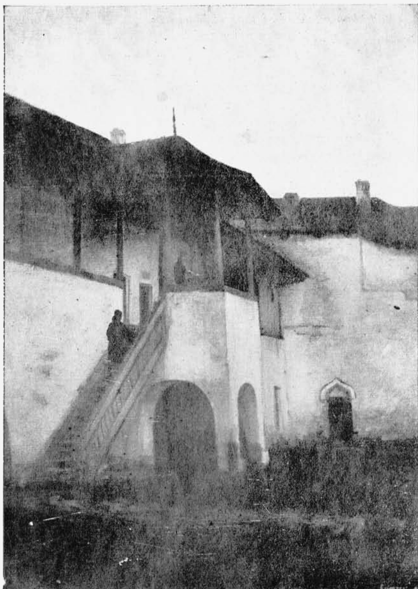
Scara dela M-rea Căldărușani.