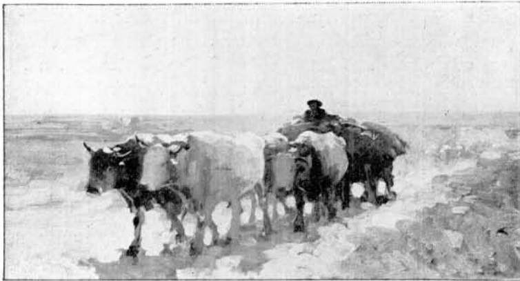
Car cu boi.

nindu-se meru, învâluie natura, eră într'adevăr o novațiune îndrăzneată. Puțini numai au apreciat-o dela început chiar și în Franta. Artistul român este printre fruntașii promotori ai școalei noi.