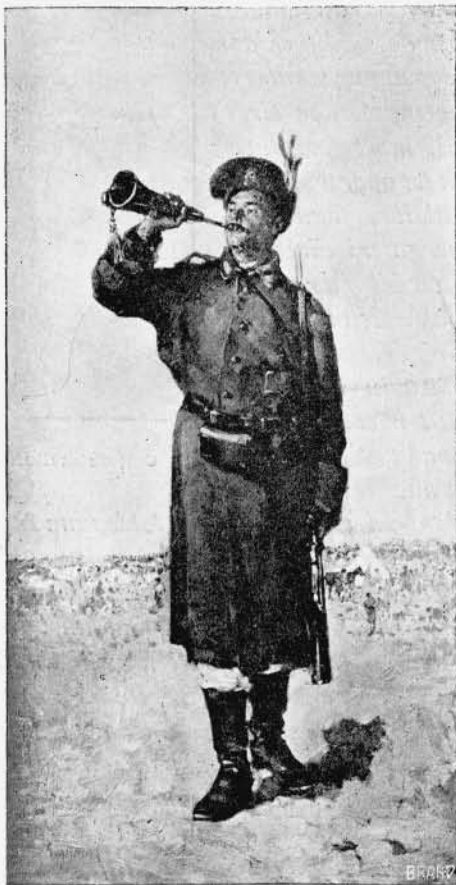
Alarma. — Rahova, 9 Nov. 1877.

Nicolae Grigorescu s'a dus; in urma lui rămâne însă cea mai frumoasă glorie a neamului românesc din preajma veacului XX. Cu ea ne vom putea fâli în toate timpurile și peste toate hotarele. Căci deși geniu al țării noastre, măestria artei lui e universală cași frumosul pe care-l intrupează. Opera lui, colosală ca producțiune și măreață ca concepție, nu