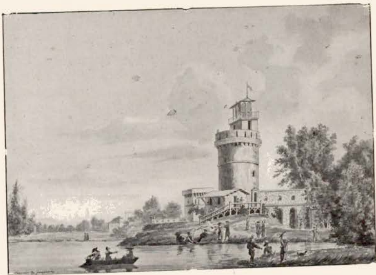
N o 21. — ERMENONVILLE.