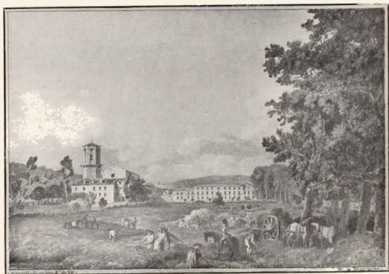
N° 5. — LE LUC.