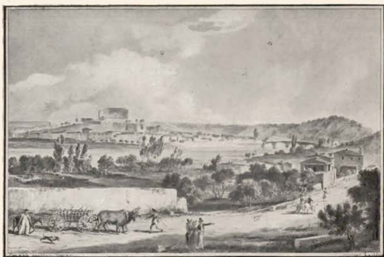
N° 1. — ALAIS.