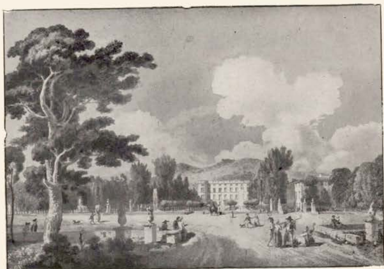
N° 4. — GEMENOS.