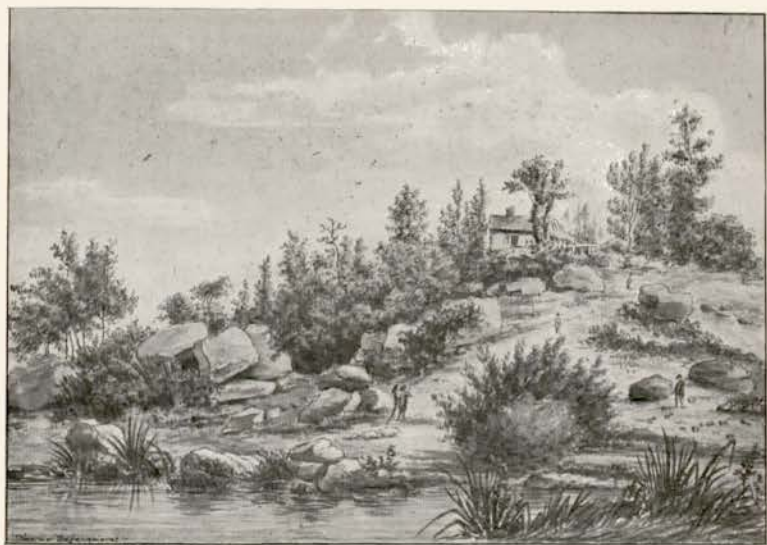
N° 20. — ERMENONVILLE.