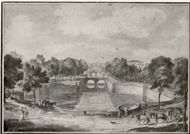
N° 7. — NIMES.