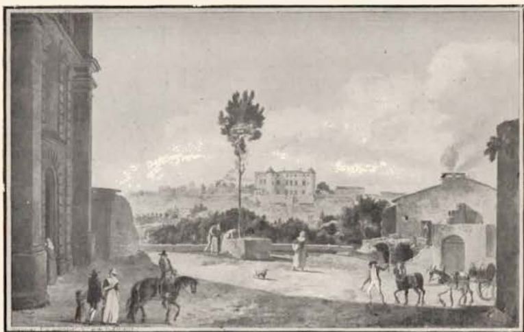
N° 2. — AUJARGUES.