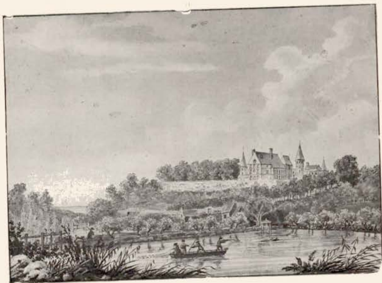
N o 24. — MAUCREUX.