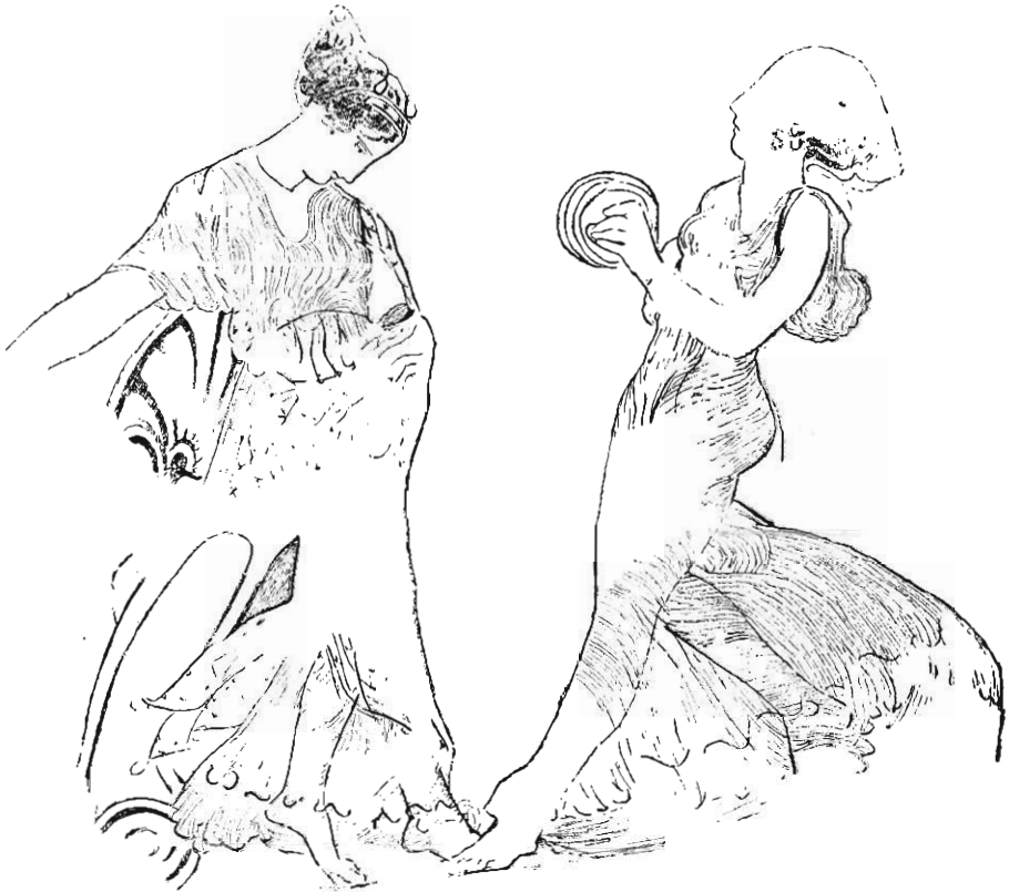
PEINTURE D'UN VASE GREC.

Dans cette évolution rapide de la statuaire, on a tout lieu d'attribuer une