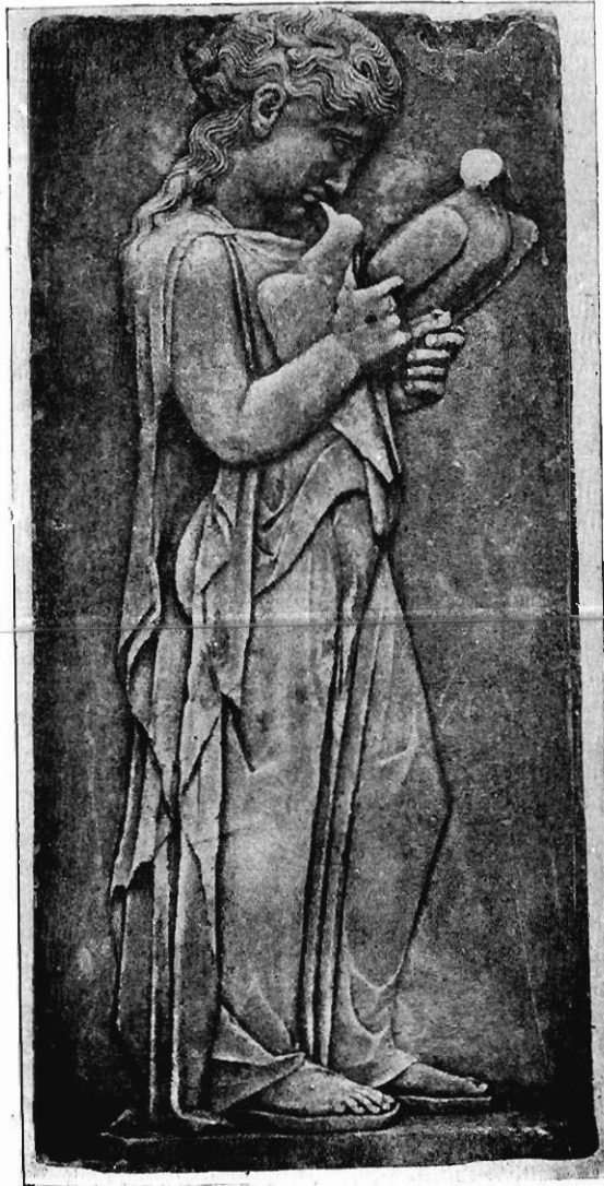
BAS-RELIEF DÉCOUVERT DANS L'ÎLE DE PAROS.

on attribue aujourd'hui l'introduction en Attique à des marbriers de l'île de Chios. Malgré la solennité et la raideur de l'attitude, cet art est déjà bien loin