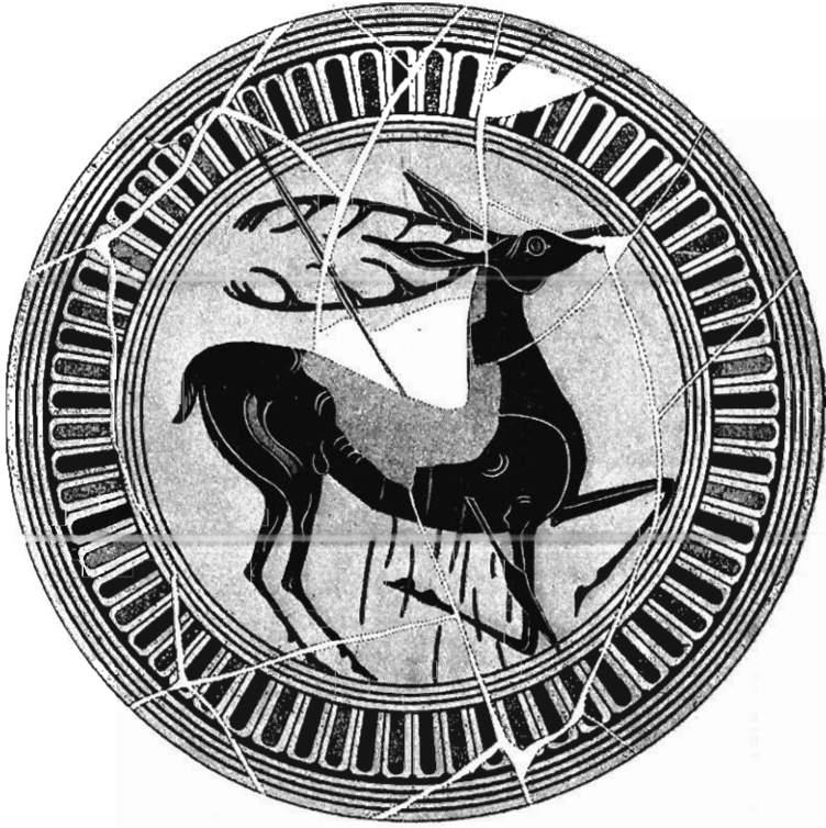
PEINTURE DE VASE DÉCOUVERTE A VULCI (ITALIE).

Le céramiste et le sculpteur anonymes auxquels nous devons ces chefs-d'œuvre se sont arrêtés l'un et l'autre, dans leur recherche amoureuse de la grâce, au point extrême où elle dégénère en manière et cesse de s'appuyer sur l'observation loyale de la nature. Tous ceux qui ont étudié, à Pompéi et à Herculanium, les reflets de l'art alexandrin, savent que les anciens, comme les