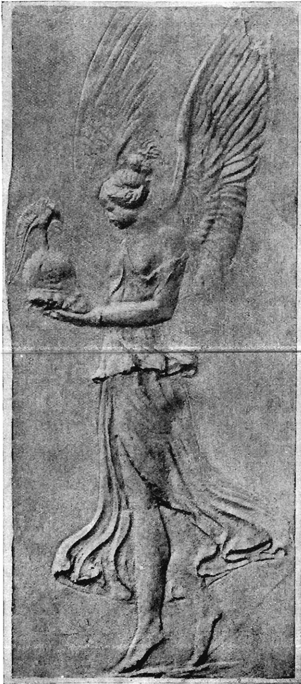
BAS-RELIEF EN TERRE CUITE DES JARDINS DE LA FARNÉSINE, A ROME.