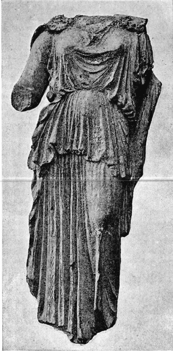
STATUETTE EN TERRE CUITE.