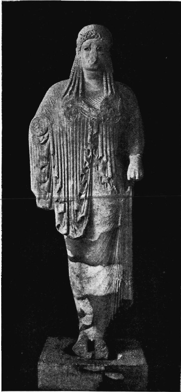
STATUE D'ANTÉNOR. (Découverte sur l'Acropole d'Athènes.)