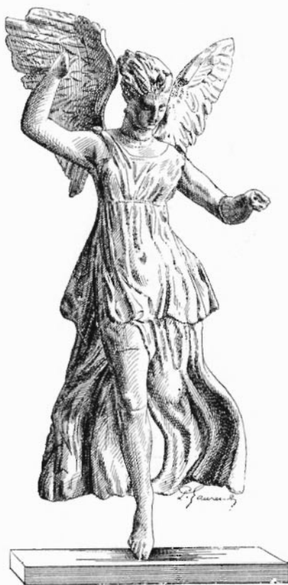
FIGURE DE FEMME AILÉE.

que la pointe fine d'un couteau. De plus, et c'est là une observation de la plus haute importance, la plupart des objets sont cassés systématiquement 1 . Ce qui prouve bien que ces brisures sont intentionnelles, c'est que les bronzes, malgré leur nature résistante, ne sont pas plus épargnés que les verreries et les terres cuites. On constate aussi que les fragments d'un même objet se trouvent très loin l'un de l'autre.