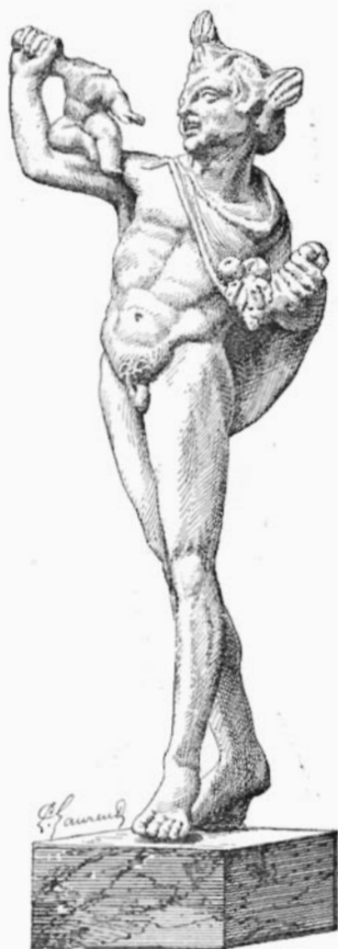
FIGURE DE SATYRE PORTANT BACCHUS ENFANT.

de repos (n os 180, 181), Bacchus groupé avec Éros et une panthère (n o 479), Éros tirant de l'arc (n o 101), Aphrodite assise sur un oiseau (n os 41 à 43), Junon diadémée (n o 196), Minerve casquée tenant une patère (n o 197), Diane chasserresse (n o 198), etc. Peut-être faut-il voir l'imitation d'un sujet local et d'un trophée élevé à Pergame, en