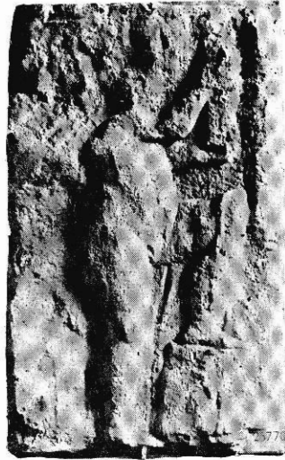
Fig. 6. — Génie suspendant le glaive de Mars (autel de la Cité).

tée par les Druides, au moment de la guerre civile entre César et Pompée 2 . On sait aussi que des combats furent livrés en Aquitaine, sur les Alpes et sur le Rhin 3 ; toutefois, l'ensemble du pays paraît être resté tranquille ; il s'agit plutôt, à cette époque, d'une lutte de guerillans sur les frontières, d'une série d'opérations de police. Les désastres des Romains en Germanie, vers l'an 8 après notre ère, ne peuvent manquer d'avoir eu quelque écho en Gaule. Mais il faut aller jusqu'en