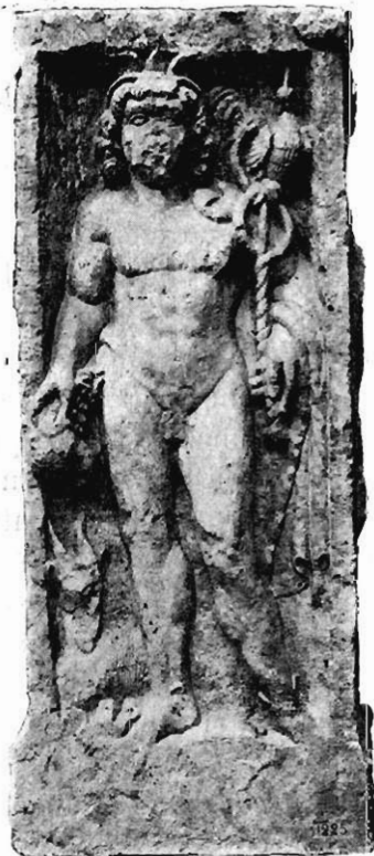
Fig. 2. — Mercure sur un autel de Paris.

Le type gallo-romain du tricéphale avait éveillé la curiosité de Bertrand, qui en réunissait au Musée de Saint-Germain une collection aussi nombreuse que possible, originaux et moulages, et en fit connaître la plupart dans son mémoire sur l'autel de Saintes et les triades 2 . Je décrivis à mon tour ces monuments en 1886, dans mon Catalogue sommaire du Musée, et j'en donnai une liste très détaillée, avec d'amples développements, dans mes Bronzes figurés de la Gaule romaine , publiés en 1894. Une gravure à grande échelle du bas-relief principal de l'Hôtel-Dieu, conservé au Musée Carnavalet, mais dont le Musée des Antiquités Nationales possède un moulage, parut en 1899 dans mon Guide illustré au Musée de Saint-Germain 3 .