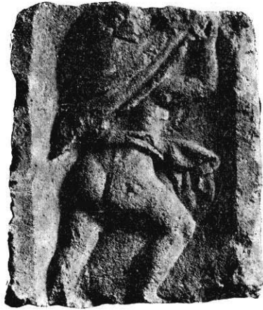
Fig. 5. — Génie emportant le bouclier de Mars (autel de la Cité).

M. Rhys pense que, dès l'époque de César, où Mercure est nommé en première ligne et Mars en troisième, le progrès des arts de la paix chez les Celtes continentaux avait assuré la primauté à Mercure et que cette primauté s'accusa encore, aux dépens de Mars, pendant la domination romaine; toutefois, à l'époque même de César, les temples municipaux de Mars servaient de trésors et recevaient le bu-