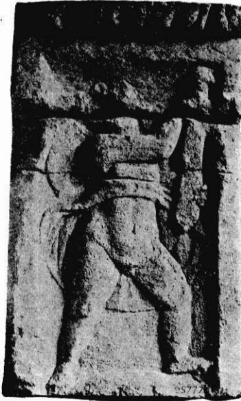
Fig. 4. — Génie emportant le glaive de Mars (autel de la Cité).

monument symbolique de la pacification ou du désarmement de la Gaule sous Tibère, témoignage plus ou moins sincère de la fidélité et du loyalisme des Parisiens.