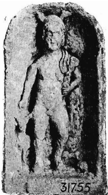
Fig. 3. — Mercure de Saint-Apollinaire (Côte-d'Or).

Si la tête de bélier, que le dieu tient de la main gauche, pouvait déjà être considérée comme un attribut de Mercure, le bouc couché à sa droite ne laisse aucun doute à cet égard. Il suffit de rappeler un Mercure gallo-romain debout, décorant une des faces d'un autel découvert à Paris en 1784 2 , qui tient une bourse du bras droit abaissé et à droite duquel