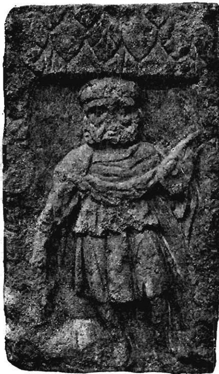
Fig. 1. — Tricéphale de l'Hôtel-Dieu.