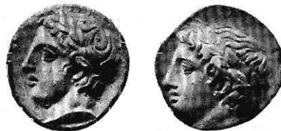
Fig. 12 Münzen von Chalkidike.

Um klar zu bleiben, wollte ich die Linie der Beweisführung voranstellen; was sich sonst noch beibringen läßt, sind nur Nebendinge, die sicher nicht verneinend entscheiden können, wenn einmal der Grundgedanke als richtig anerkannt werden muß.