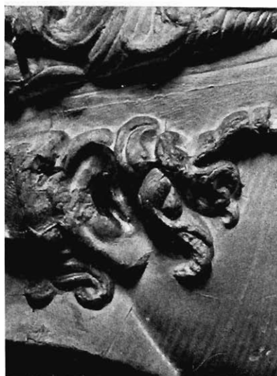
Fig. 13 Ohr des Dresdner Diadumenos.