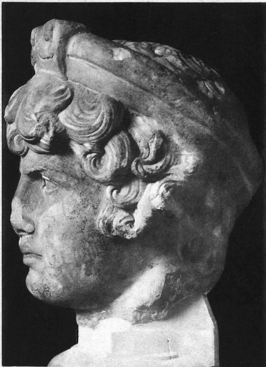
TÊTE D'ANTINOOS AU MUSÉE DES THERMES