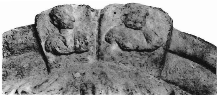
TÊTE D'ANTINOOS - FACE ET DÉTAIL