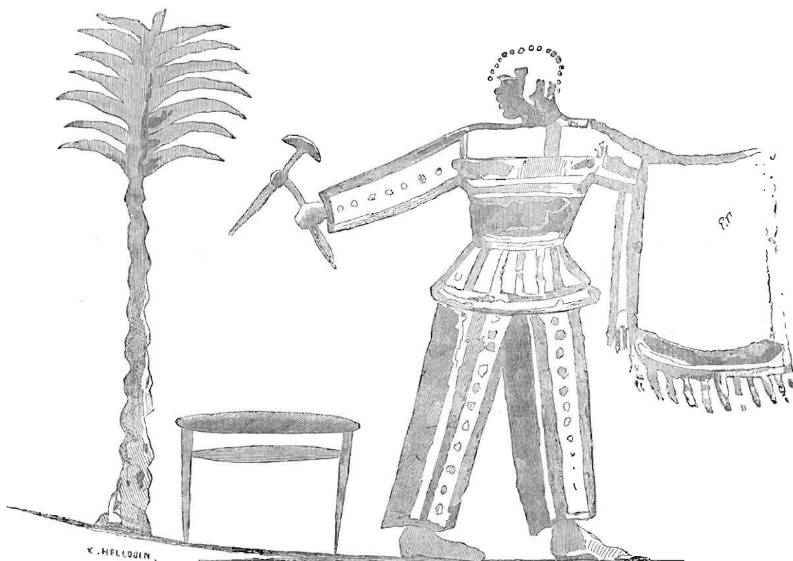
Alabastron du Musée de Compiègne.

Quel que soit le nombre des Amazones — et il est incalculable — que nous rencontrons sur les monuments, il ne s'en est pas encore trouvé une seule qui porte le type éthiopien. Toutes celles qui concourent à la défense de Troie, sont d'origine asiatique. Parfois, mais rarement, Memnon est suivi d'un cortège de négrillons, ou bien les poètes et les rhéteurs se permettent des allusions à son teint noir (2); néanmoins