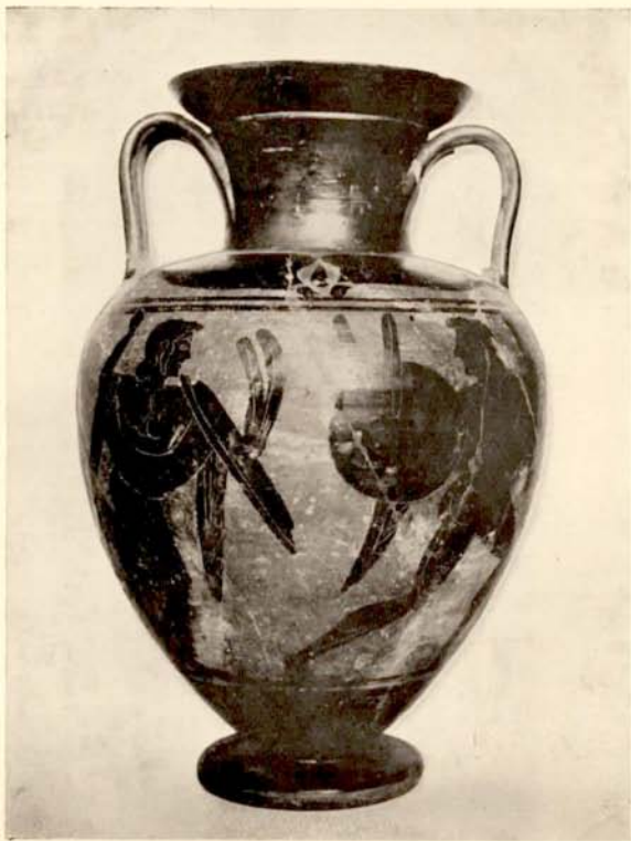
1. Etrurische amphora in het Nederlandsch Lyceum.