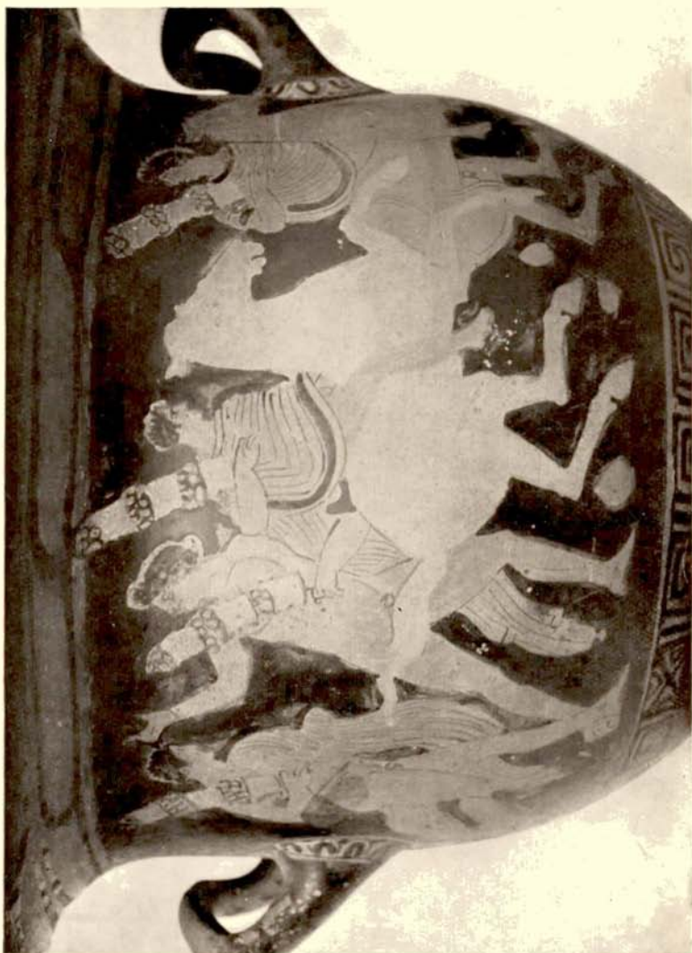
3. Zuid-Italische krater te Florence.