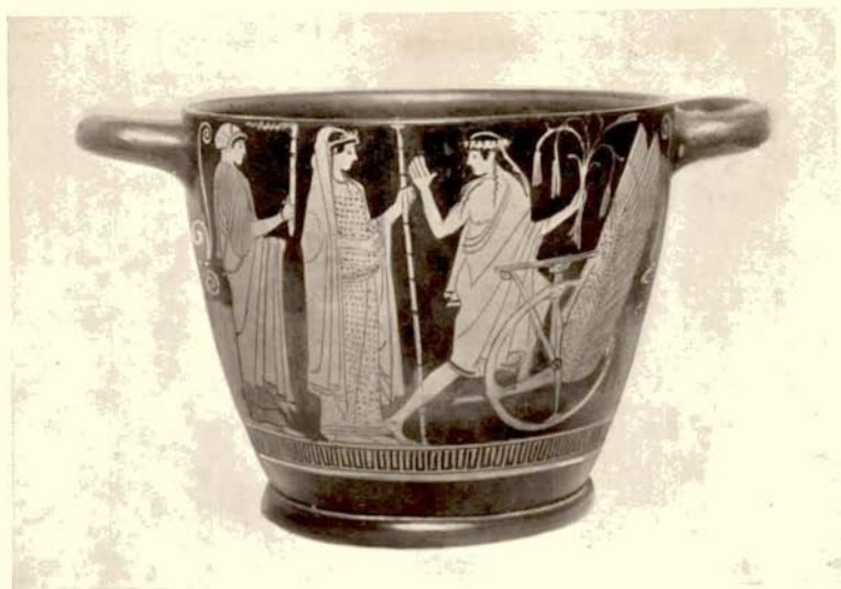
4. a. Attische skyphos te Brussel.