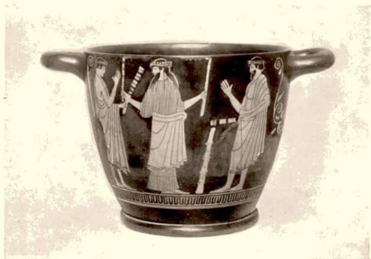
4. b. Attische skyphos te Brussel.