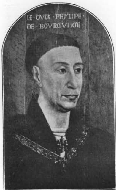
PHILIPPE LE BON, DUC DE BOURGOGNE. Palais royal de Madrid.

La date de 1454, qui nous est fournie par un document d'archives, ne nous permet pas d'admettre l'hypothèse, proposée par M. Lafenestre, d'un Louis XI même jeune, représenté sous les traits de saint Louis, puisque Louis XI ne monta sur le trône qu'en 1461. Resterait donc la figure de Charles VII.