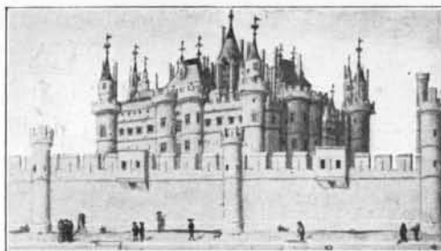
LE LOUVRE. D'après les Très riches Heures du duc de Berry .