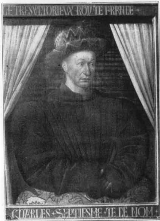
JEAN FOUQUET. — CHARLES VII. Musée du Louvre.