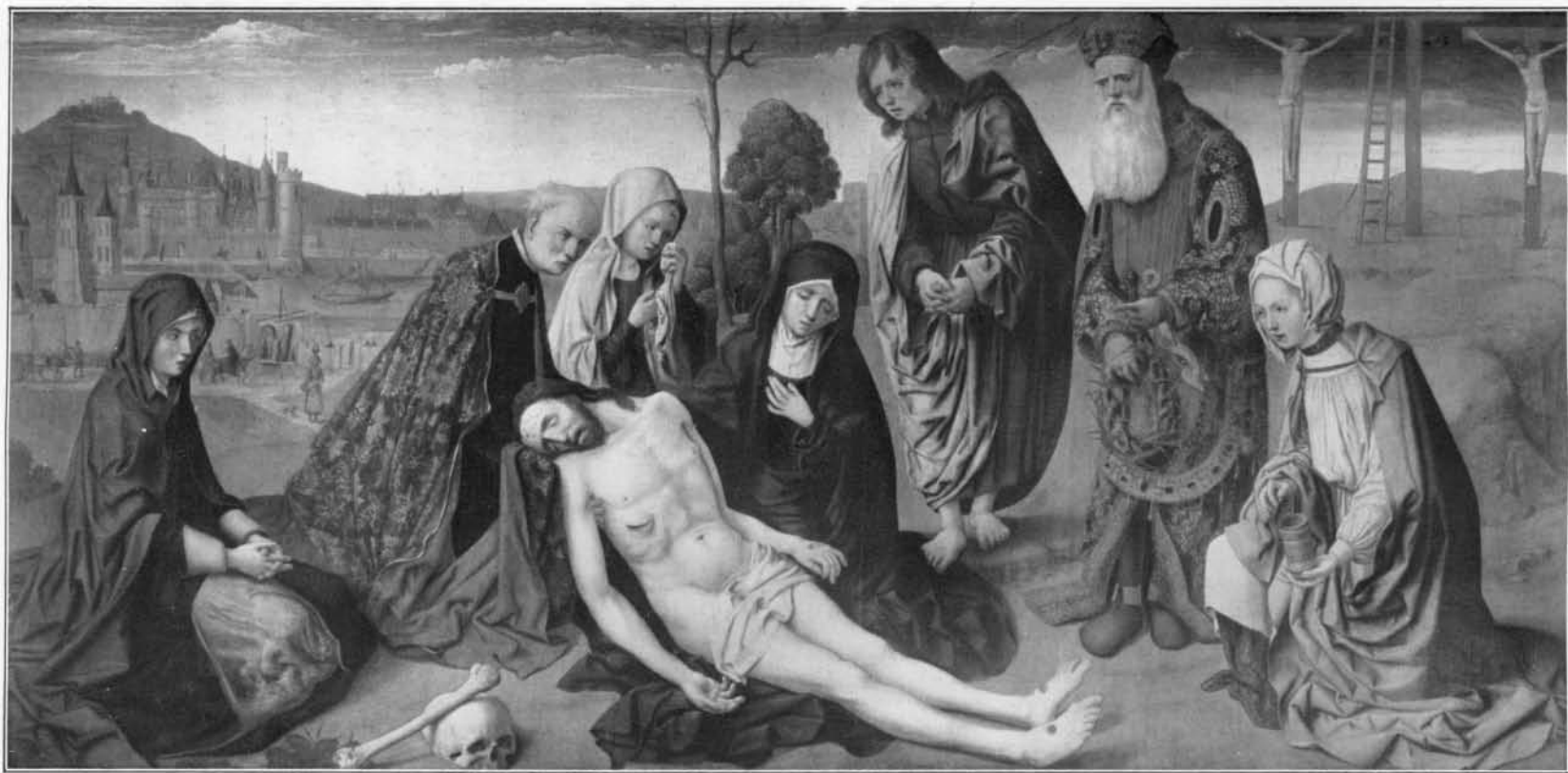
ÉCOLE FRANÇAISE (XV e SIÈCLE). — DÉPOSITION DE CROIX.

Peinture provenant de Saint-Germain-des-Prés (Musée du Louvre).