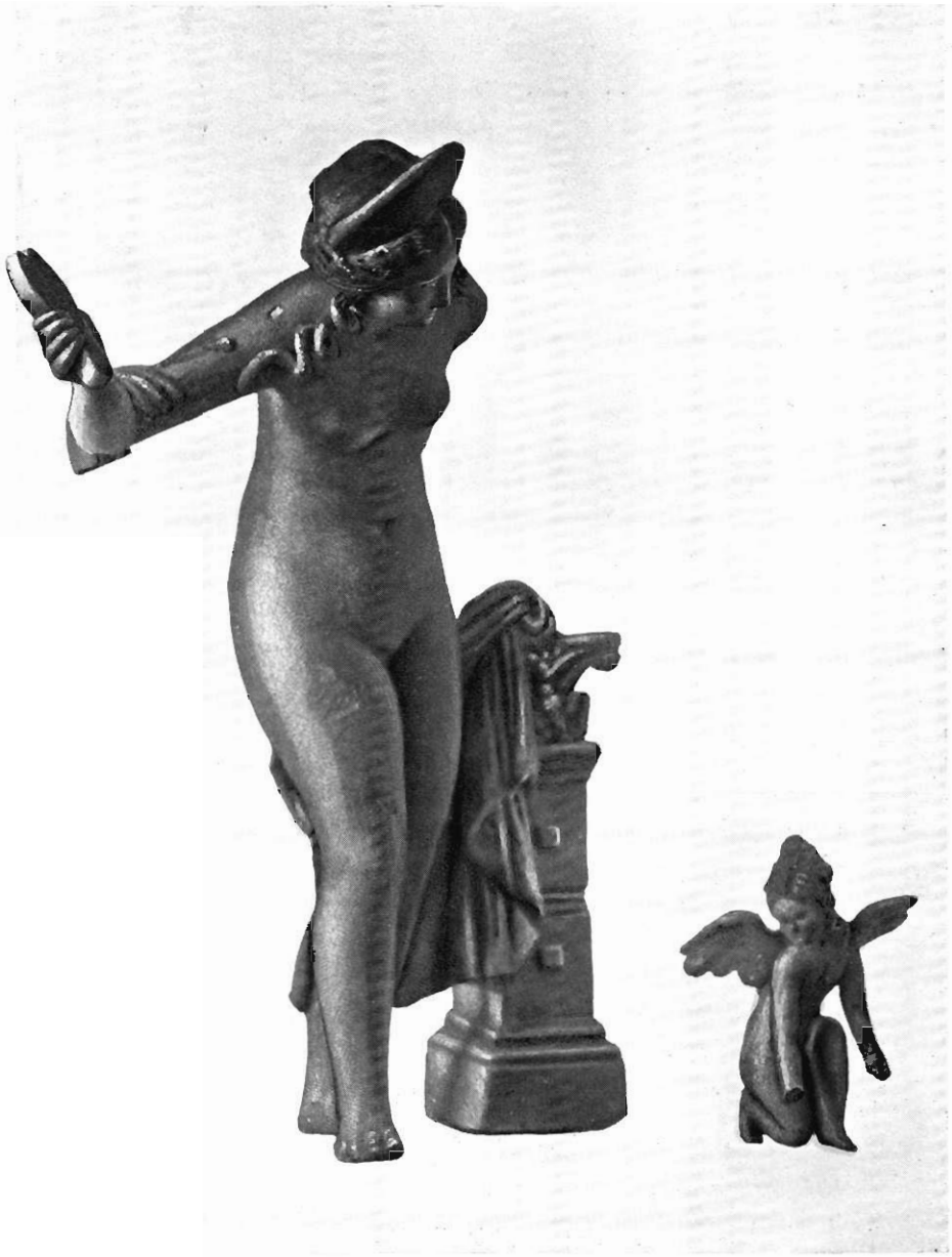
APHRODITE ET EROS (TERRE CUITE DU MUSÉE D'ATHÈNES)