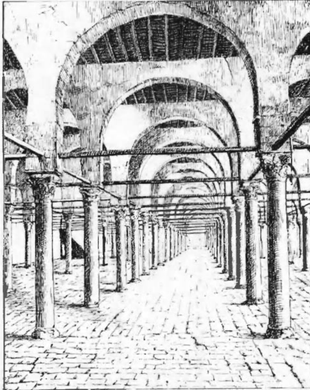
INTÉRIEUR DE LA MOSQUÉE D'AMROU, AU CAIRE.

réimpression d'articles parus dans le journal le Temps au lendemain de l'inauguration du canal de l'isthme de Suez, inauguration très-brillante, on s'en souvient, à laquelle avait été libéralement conviée par le khédive l'élite intellectuelle de la France. Parmi ceux de nos compatriotes qui eurent alors l'inappréciable fortune d'assister à ces fêtes, qui se terminèrent par une pointe en commun à travers les merveilles de la haute Égypte, du Caire à Philæ, se trouvaient à côté de M. Charles Blanc, MM. Guil-