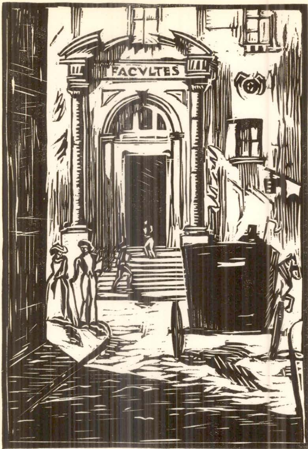
LA FACULTÉ DES LETTRES JUSQU'EN 1896

L'entrée sur la rue de l'Hôtel-de-Ville.