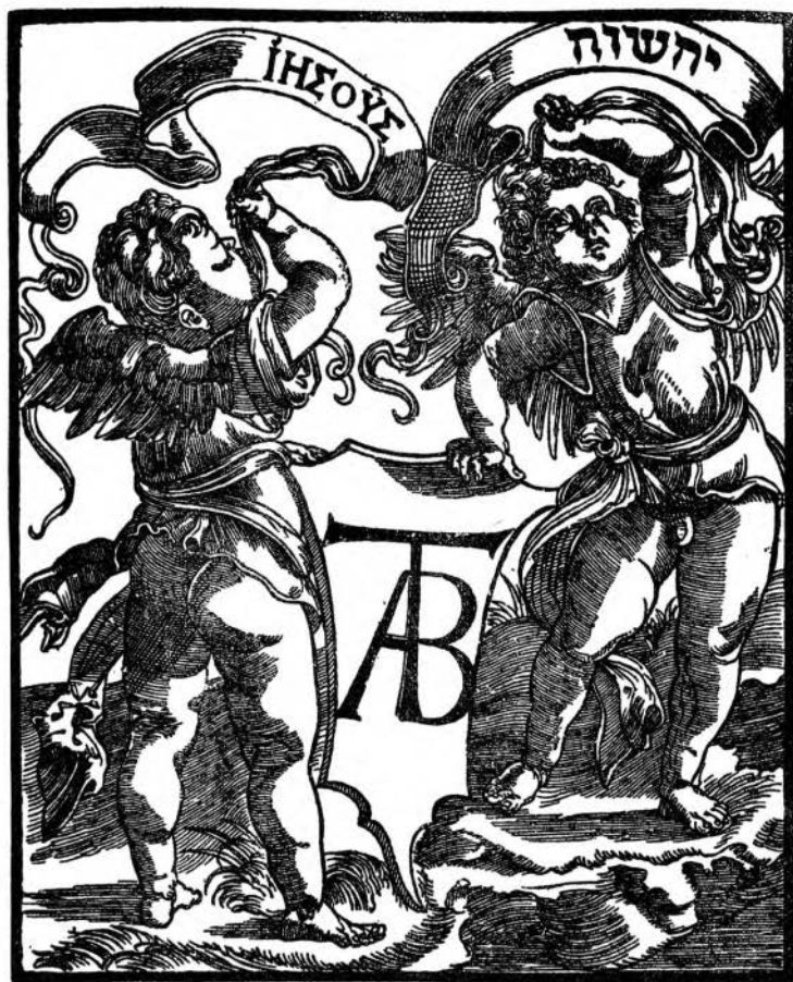
(N° 771 des Marques typographiques de L. C. Silvestre).