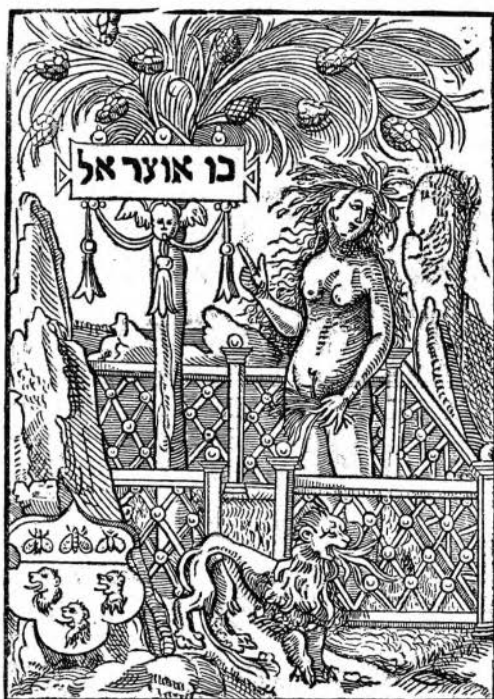
Marque typographique de J. B. Silvestre, n° 554.

Bossozel , selon la mode de l'époque imitant les concetti italiens. — Nous avouons ne pas savoir ce que maître Bossozel a imprimé en fait d' Hebraïca , pour justifier l'inscription de sa marque. Ne serait-ce qu'une enseigne trompeuse? Nous l'avons vue sur une édition des Comment. de Thomas de Vio, en 1536-7 (B. N., in-fol., A, 1919, inv.).