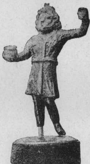
FIG. 5. — Statuette de Cairanne (Vaucluse).

A ces raisons, et à d'autres que j'ai exposées ou rappelées en 1895, M. Michaelis répond par l'aveu que « dans certains cas isolés » des traits de Sérapis ont pu être empruntés pour représenter le dieu au maillet, mais que le type plastique de