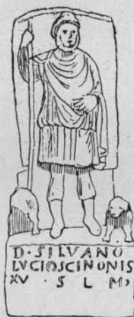
FIG. 3. — Bas-relief de Ramsen.

trouvons des noms tout différents de ceux auxquels on pouvait s'attendre. Cette circonstance est surtout fâcheuse, à mon avis, pour la thèse des épigraphistes. En effet, les archéologues se contentent de dire que le dieu au maillet est un dieu chthonien indigène, auquel César, en quête d'assimilations un peu hâtives, a donné le nom de Dispater ; ils n'ont jamais prétendu que les Gaulois aient appelé Dispater leur dieu au maillet. En revanche, les épigraphistes ont soutenu que le dieu au maillet n'était autre que Silvain, thèse justifiée, au premier abord, par les autels avec dédicaces à Silvain où figurent des marteaux, et par un