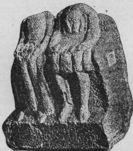
FIG 4. — Bas-relief de Sulzbach.

Dans le cas présent, la réponse à une objection analogue est encore plus facile. On n'a même pas besoin de rappeler