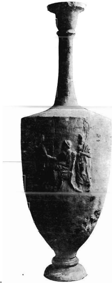
VASE FUNÉRAIRE ATTIQUE

On sait que la Sirène est fréquente sur les monuments funéraires, tantôt en ronde bosse, tantôt en relief; on trouve encore des statues isolées de Sirènes placées sur des tombes. Pourquoi? C'est ce qu'il est difficile de dire. Parfois la Sirène funéraire presse ses seins ou tord ses cheveux en signe de douleur; parfois elle joue de la lyre; parfois