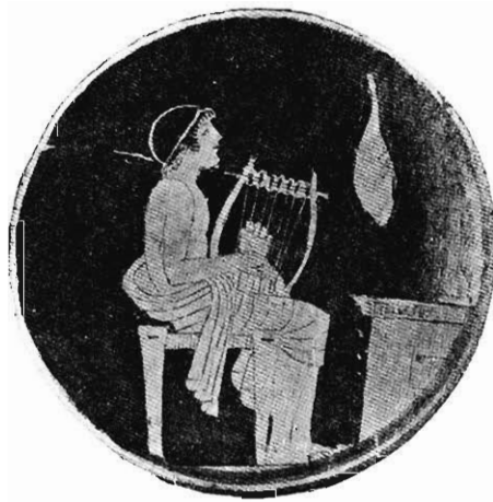
JOUEUR DE LYRE PEINTURE D'UNE COUPE D'ÉGINE (Musée de New-York.)