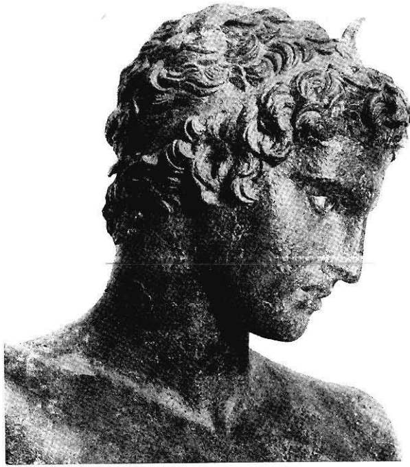
TÊTE DE LA STATUE EN BRONZE DE MARATHON

Le nettoyage dura huit mois ; il fut exécuté sans l'aide d'acides, avec des précautions infinies qui respectèrent la patine. On peut apprécier maintenant toute la beauté, toute l'exquise élégance de cette figure juvénile, offerte à l'admiration des visiteurs du Musée d'Athènes et aussi aux controverses des archéologues. Car, depuis la découverte de l'Apollon du Belvédère jusqu'à celle de l'éphèbe de Cerigotto, en passant par l'Aphrodite de Mélos, l'Hermès d'Olympie et la Fanciulla d'Anzio, c'est