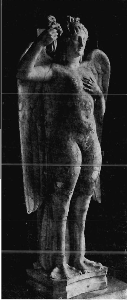
SIRÈNE, SCULPTURE ATTIQUE

Tout récemment, en juillet 1928, on a déterré par hasard, dans le quartier Byron à Athènes, un grand relief funéraire à trois personnages : une femme assise serre la main d'un homme debout devant elle, tandis qu'entre les deux une nourrice porte un enfant au maillot. Le fronton de la stèle, que nous comptons reproduire un jour, est surmonté d'une Sirène aux ailes déployées 1 .