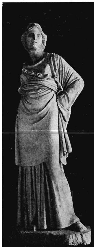
STATUE EN MARBRE

de 0 m 78, cette belle statue de style grec offre des analogies frappantes avec les Néréïdes du monument de Xanthos en Lycie, bien que les dimensions en soient inférieures à celles des statues de cette provenance, conservées au British Museum. Ce qu'il y a de vraiment admirable dans celle-ci, c'est la draperie transparente collant au buste et les beaux plis formés par le manteau flottant, comme dans la Niké de Samothrace. On peut aussi rappeler, comme l'a fait Sir Ch. Walston, les