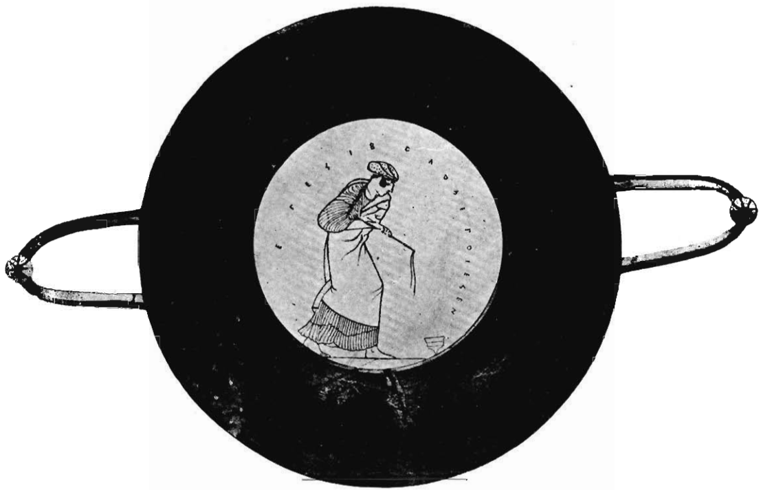
JOUEUSE DE SABOT, PEINTURE D'UNE COUPE A FOND BLANC (Musée de Bruxelles.)