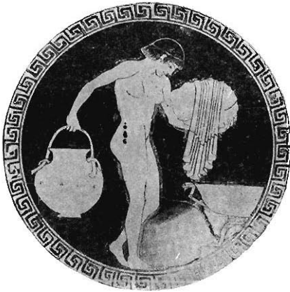
BAIGNEUSE PEINTURE D'UNE COUPE (Musée de Bruxelles.)

d'une coupe du Musée du Cinquantenaire à Bruxelles 1 . Elle porte de la main droite un grand vase métallique vide, sur la gauche ses vêtements roulés en paquet, et s'approche d'un bassin de métal orné d'un serpent, formant peut-être robinet. Je pense qu'elle va remplir la situle pour en répandre ensuite le contenu sur elle, mais n'en suis pas sûr; ce qui ne laisse pas de doute, c'est le charme du mouvement et du dessin. (Œuvre de Brygos, opine l'un — peinture d'Onesimos, répond l'autre. Je pourrais m'amuser à proposer un troisième nom, mais m'en abstiens; il y avait, vers le milieu du ve siècle, bien des artistes exquis qui n'ont pas pris la peine de signer. Mais notre curiosité légitime demande tout au moins que les peintures anonymes de vases grecs soient classées d'après les affinités qu'elles présentent, et c'est ce que