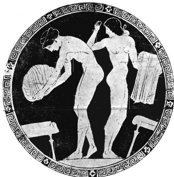
JEUNES FILLES AU BAIN PEINTURE D'UNE COUPE

Ce même Musée Métropolitain, à qui les acquisitions les plus coûteuses sont permises, a acheté, en 1925, un autre chef-d'œuvre de la céramique athénienne, une kylix très rapiécée, mais peu restaurée, dont le fond offre l'image de deux jeunes filles qui, au moment de se baigner, déposent leurs vêtements sur des tabourets. A quoi bon louer une pareille peinture ? Il faudrait être aveugle pour ne pas l'admirer, et je pense à la joie qu'elle eût causée à Ingres s'il l'avait eue sous les yeux. La jeune fille à gauche du spectateur porte une bandelette trois fois enroulée autour