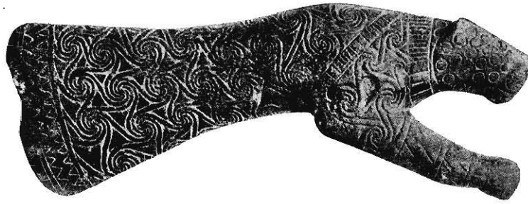
HACHE D'APPARAT EN FORME DE PANTHÈRE