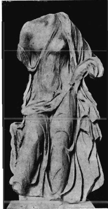
STATUE EN MARBRE DE NÉRÉIDE (?) (Burlington House, Londres.)

J'ai souvent, au cours de ces études, narré la découverte de statues d'origine