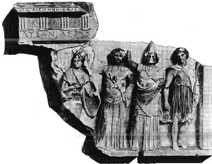
BAS-RELIEF POLYCHROME, DÉCOUVERT A BENGHAZI

cinquième. La figure à la gauche du spectateur est évidemment Athéna, représentée