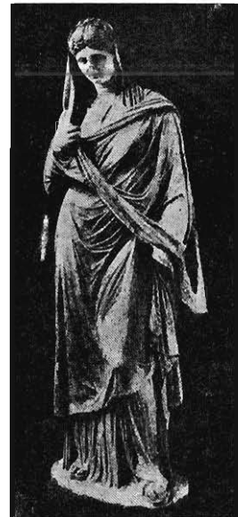
STATUE FUNÉRAIRE DÉCOUVERTE À ATHÈNES (Musée d'Athènes.)

sait, elles ont rendu au jour une vaste nécropole remontant, pour la couche la plus ancienne, au v e siècle. Parmi les trouvailles, on cite un relief funéraire d'une femme assise donnant la main à un enfant; un grand vase dit loutrophore à figures noires; une péliké à figures rouges; de jolis lécythes blancs et deux statues funéraires en marbre, dont l'une est intacte. Le motif est celui des statues du Musée de Dresde trouvées, au xviii e siècle, à Herculanum, motif qui a été sans cesse reproduit par la sculpture gréco-romaine et dont j'ai proposé d'attribuer la création à Lysippe, alors que d'autres ont pensé à Praxitèle. On en a déjà exhumé de beaux exemplaires en Grèce même, notamment à Olympie. Imaginé peut-être pour figurer les Muses, il a été adopté par les tombiers pour devenir l'ex-