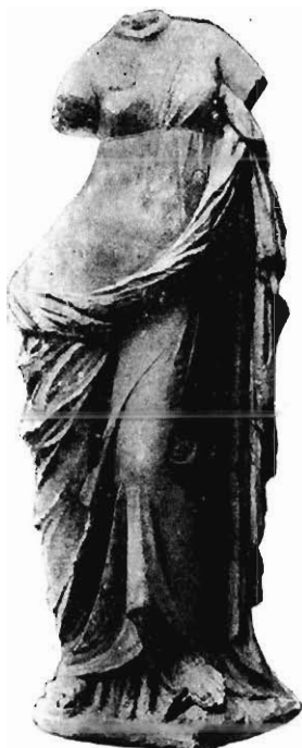
APHRODITE DE MARBRE DÉCOUVERTE A DOUBA-EUROPOS

La déesse, dont le torse est à peine voilé par une tunique transparente, tandis que les plis d'un lourd manteau de laine couvrent ses jambes, est figurée dans une attitude fortement hanchée , le pied gauche reposant sur une tortue. Ce n'est pas le premier exemplaire de ce motif et l'on en a découvert récemment trois autres à Benghazi et à Cyrène 2 . Souvent la tortue manque, mais il y a un dauphin près de la