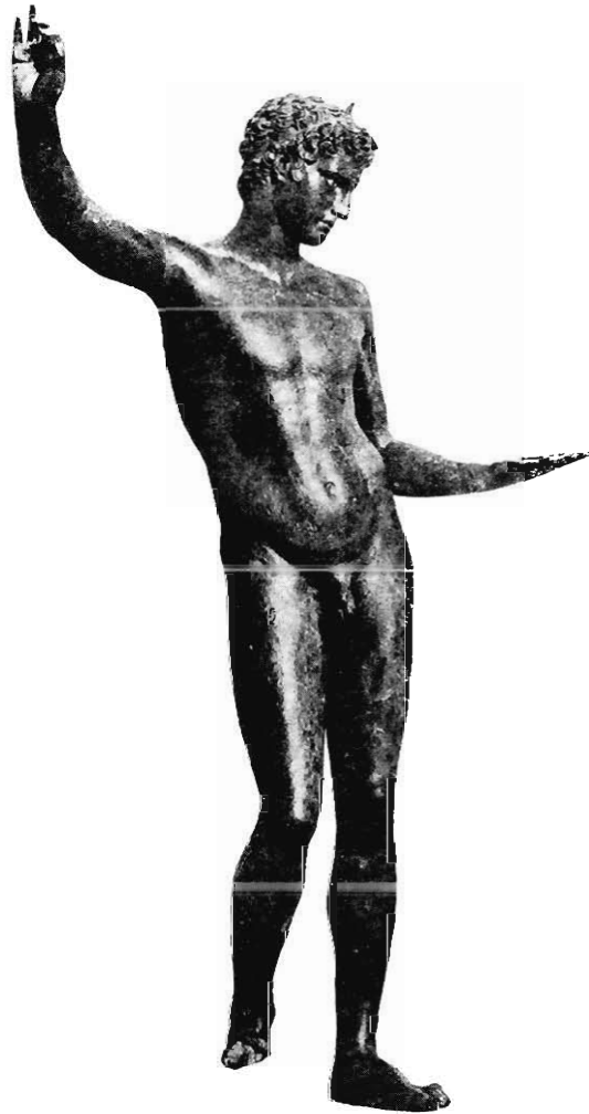
STATUE EN BRONZE D'ÉPHÈRE DÉCOUVERTE DANS LA MER PRÈS DE MARATHON

filets dans la baie de Marathon lorsqu'il ramena, vers la mi-juin 1925, une statue de bronze presque intacte, haute de 1 m 30, couverte d'une épaisse oxydation et de faune marine incrustée. Quel parti tirer de cette bonne fortune ? Pendant plusieurs jours, la barque boulingua, la pensée de Léonidas aussi ; enfin, le patron se décida à faire