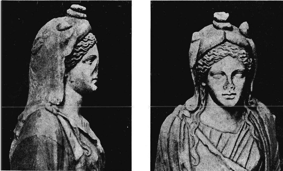
PARTIE SUPÉRIEURE D'UNE STATUE DE MARBRE DÉCOUVERTE A TOLMETTA (CYRÉNAÏQUE)

grecque du IV e siècle, quatre personnages debout et les restes insignifiants d'un