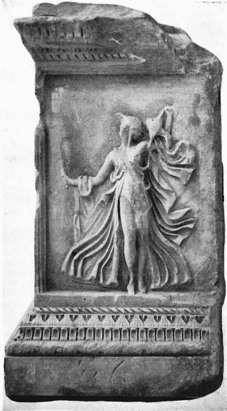
Abb. 4. Relief aus Ny-Carlsberg.

Diese Stelle scheint Hauser nicht gegenwärtig gewesen zu sein, als er ein Mänadenrelief aus Ny-Carlsberg publizierte 2) mit den Worten: