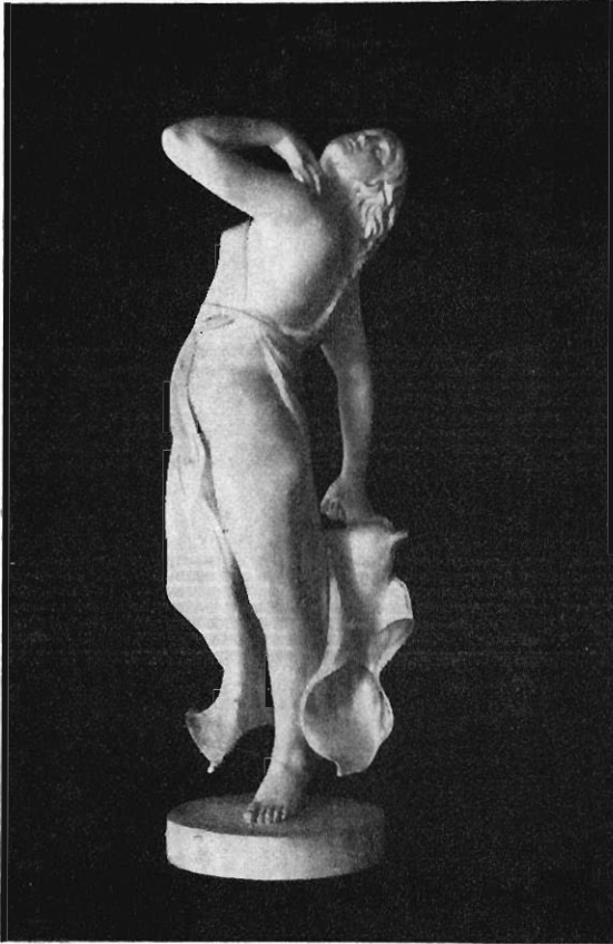
Abb. 3. Rekonstruktionsversuch.

im Ton die großen Massen und die Hauptlinien in ihrem Verlauf andeuten müssen. Dann aber hat sein plastisches Gefühl wieder die Führung übernommen, und er hat von mir verlangt, daß sich dieser Faltenfächer noch kreisförmiger entwickeln sollte, um der Statue, auch in Vorderansicht, neben reicherer Linienführung eine glücklichere Ponderanz zu geben, was sich dann leicht genug finden ließ (Abb. 3). Ich will aber nicht behaupten, daß hier nicht Besseres zu erzielen wäre. Für die