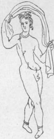
Fig. 8 Gerhard-Körte Etrusk. Spiegel

Daß eine solche Schnur auch um den Hals getragen wurde, ist an sich wahrscheinlich und wird durch die später anzuführenden literarischen Notizen (unten S. 18) bestätigt; vermutlich werden also manche der jetzt als Schmuckstücke aufgefaßten, nur durch eine schlichte Linie ausgedrückten