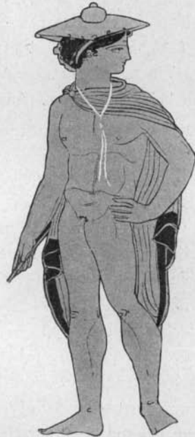
Fig. 9 Arch. Jahrb. 1896

Bänder (namentlich bei den Frauengestalten der Vasenbilder) solche einfach umgeschlungene Fäden sein. Ganz unzweifelhafte Belege bildlicher Art kann ich nicht beibringen, doch möchte ich mit allem Vorbehalt auf einen vielleicht hierher gehörigen Fall hinweisen, auf den Hermes des Berliner Andromedakraters (Jahrbuch des arch. Inst. 1896 Taf. 2, danach 1