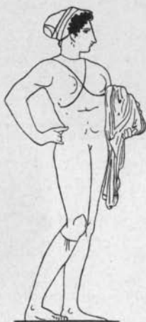
Fig. 3 Benndorf, Vasenbilder

Vasenbilder Taf. 50, 1, danach hier Fig. 3), dann bei zweien der die Pyrriche tanzenden Weiber auf der bekannten Vase in Florenz 1 , und es ist danach wahrscheinlich, daß auch an der Waffentänzerin bei Stackelberg, Gräber der Hellenen Taf. 22 ein solches Band, nicht der obere Rand eines hohen Stiefels zu erkennen ist. 2