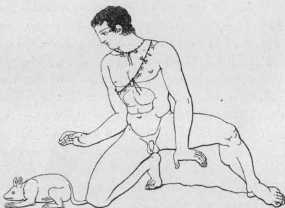
Fig. 10 Tischbein, Engravings II

hier Fig. 9); denn die weiße Schnur mit Knoten, welche lose um den Hals hängt, läßt sich nicht gut mit dem etason in Verbindung bringen, den der Gott auf dem Kopf trägt. Allerdings kommt bei Hüten der verschiedensten Form außer dem knappen, eng um den Hinterkopf gelegten Bande noch ein zweites, längeres vor, das bestimmt ist, den Hut zu halten, wenn er in den Nacken geschoben wird 1 , und das zuweilen neben dem erstgenannten dient, den Hut auf dem Kopf zu