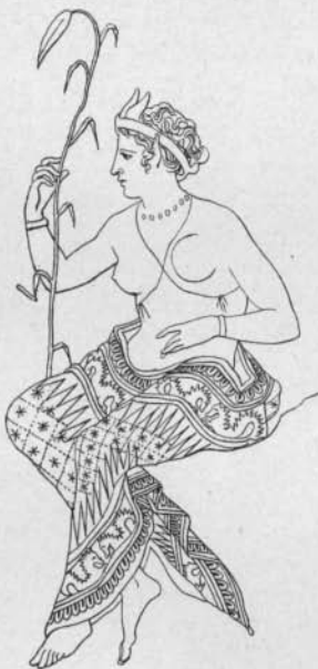
Fig. 7 Monumenti II

noch eine deutlich umgeknottete Schnur, die schräg über die Brust läuft. Diese schräg umgelegte Schnur ist bei Kindern sehr häufig und trägt bei ihnen mitunter ganze Reihen von Amuletten 1 , mitunter erscheinen aber an ihr nur eine oder mehrere Rundungen, ganz ähnlich wie bei dem besprochenen Schenkelband (es genügt, dafür die beiden Darstellungen der Erichthoniosgeburt zu nennen: Monumenti III Taf. 30. X Taf. 39); mitunter läßt sich gar nichts an ihr feststellen. Auch bei Frauen kommt diese Schnur ohne sichtbaren Knoten, aber auch ohne Anhängsel vor, sowohl einfach (z. B. bei der sterbenden Kanake, Arch. Zeitung 1883 Taf. 7), als kreuzweise umgelegt (z. B. in unserer Fig. 3 und bei Dumont, Céramique I Taf. 38). In einigen Fällen sind Knoten unzweifelhaft, so außer bei der in Fig. 5 wiedergegebenen Frau bei der Io der Vase Jatta (Monumenti II Taf. 59, danach die fragliche Gestalt hier Fig. 7), welche kreuzweise Schnüre mit deutlichen Knoten auf der Brust trägt. Dieselbe Tracht erscheint auf der Vasenscherbe in Jena, Arch. Zeitung 1857 Taf. 108, 4. Bei der einfachen schrägen Schnur erscheint zuweilen eine ganze Reihe von Knoten, so bei einem Silen auf der Marsyasvase, Arch. Zeitung 1884 Taf. 5, und besonders deutlich auf einem etruskischen Spiegel (Monumenti IX Taf. 7, 1. Annali 1869 S. 194 = Gerhard und Körte, Etruskische Spiegel V Taf. 74 S. 91, danach hier Fig. 8); vgl. auch unten Fig. 10.