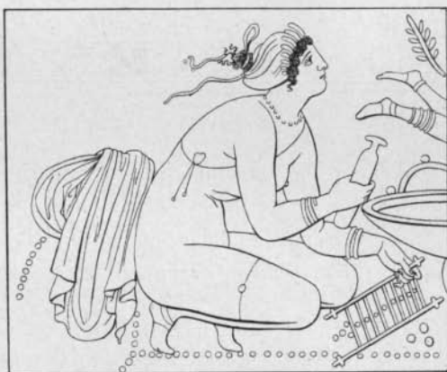
Fig. 5 Tischbein, Coll. of Engravings III

die eine der beiden ganz gleichen Gestalten in unserer Fig. 5 wiederholt). Daß hier ein Ring angebunden sei, wie Ch. Lenormant (zur Élite des mon. céramographiques IV Taf. 14 S. 99) meinte, läßt