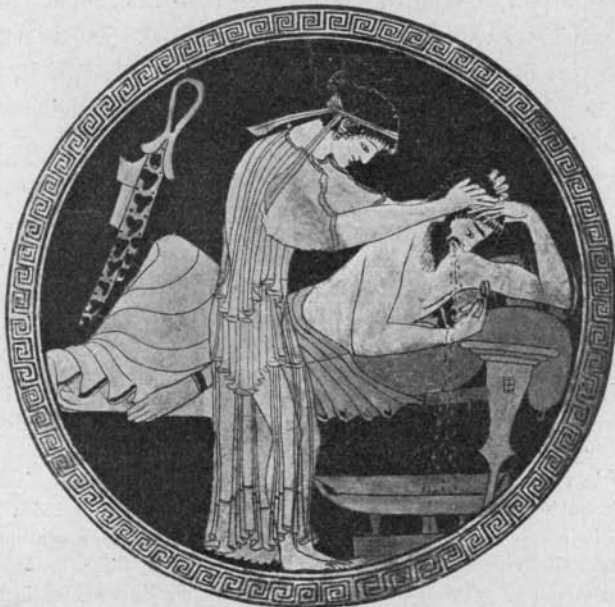
Fig. 2 nach Photographie

Für das Band am Fußknöchel treten vor allem wieder die beiden an erster Stelle genannten Vasen ein. Sodann darf man hier vielleicht einige Darstellungen des Theseus auf Vasenbildern nennen (Monumenti I Taf. 52. Furtwängler, Griech. Vasenmalerei Taf. 5. Museo Gregoriano II Taf. 66, 1 = Ausgabe B Taf. 62, 1), denn er soll doch sicher ebensowenig wie Demophon in dem eben genannten Falle als weichlich oder