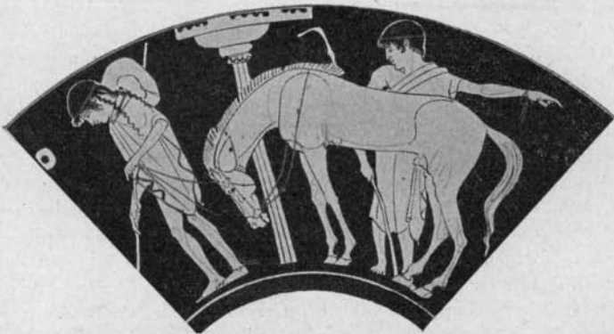
Fig. 1 Furtwängler, Vasenmalerei

Am Handgelenk tragen ein solches Band die Knaben auf den eingangs genannten beiden Schalen, der in Hamburg und der in München; ein Ausschnitt aus ersterer wird hier Fig. 1 wiedergegeben. 2 Ob auf der Schale des Peithinos