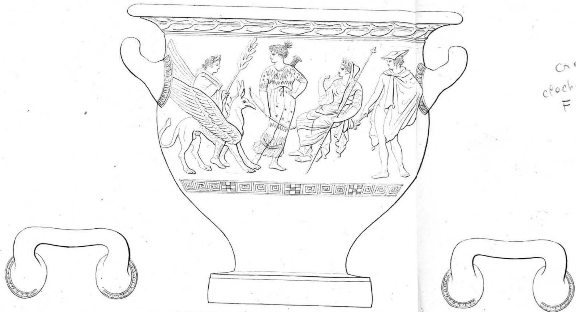
Un palmo siciliano Forma del Vaso