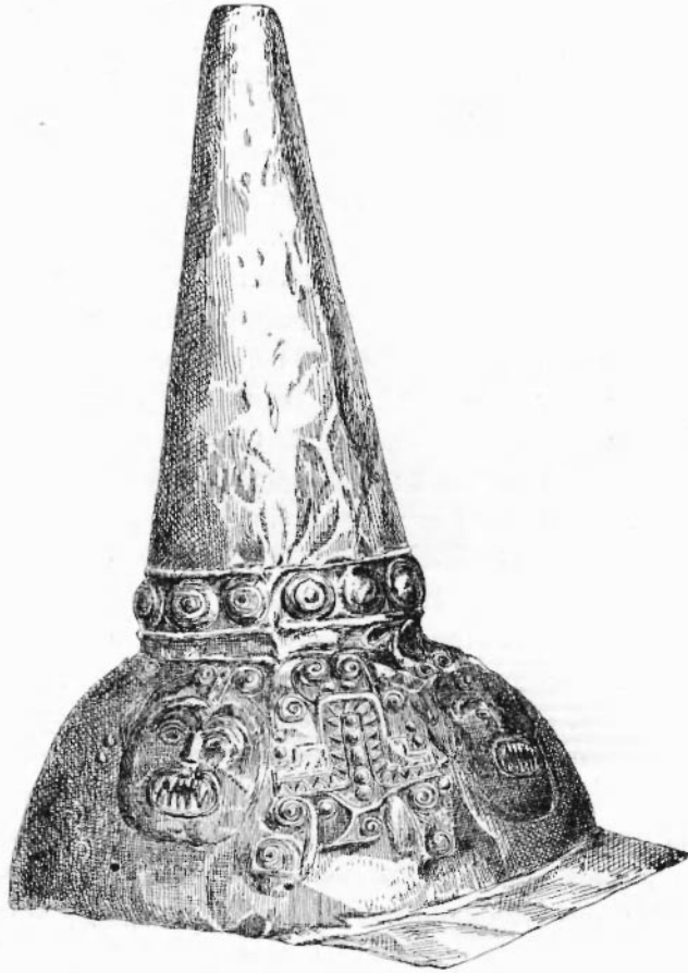
CASQUE PÉRUVIEN EN OR.

duit pas un dessin plus naïf que l'image laborieusement écrite dans l'épaisseur du métal par l'ouvrier péruvien. Toutefois la répétition de certains détails caractéristiques montre que ce n'est pas une fantaisie enfantine, mais la volonté de reproduire un type consacré qui a conduit cette main inhabile. On notera, comme des singularités, la double ligne,