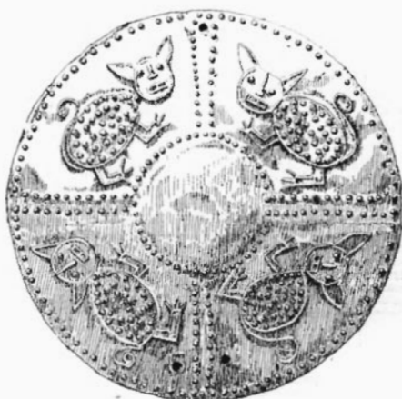
PLAQUE CIRCULAIRE EN OR.

Les figures, disposées de manière que deux d'entre elles seulement soient affrontées, marquent le côté du disque qui devait se présenter en haut. On observe, en effet, à cet endroit un ou deux trous, qui se répètent souvent sur le bord diamétralement opposé; ils devaient