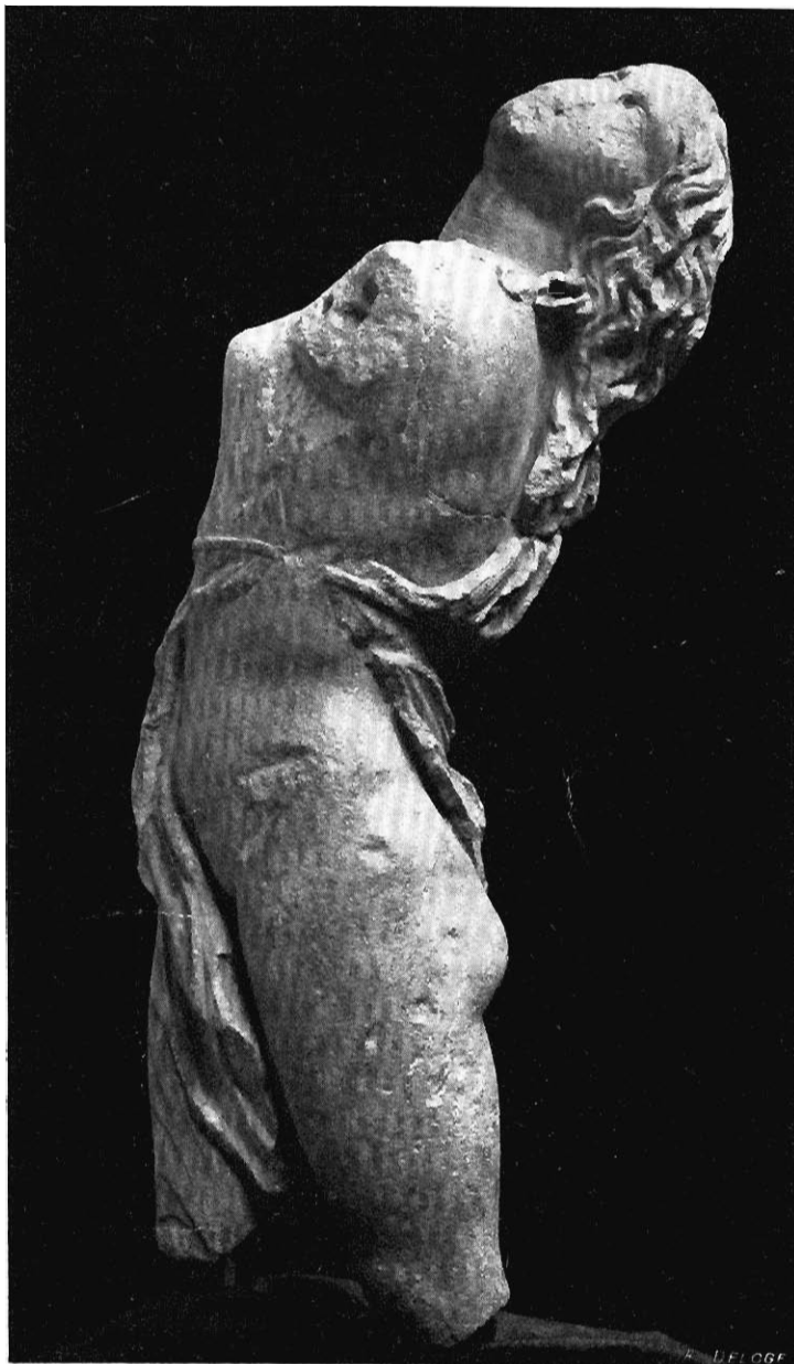
STATUETTE DE MÉNADE (Alberinum de Dresde).