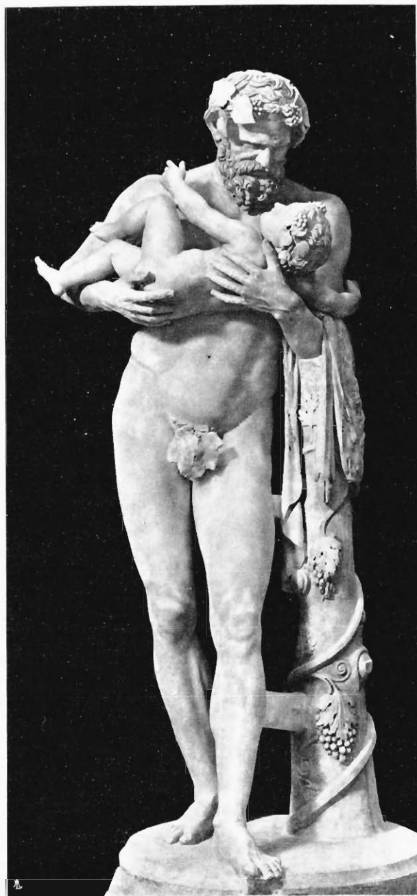
Fig. 3 - Silenos e Dioniso - Museo Vaticano