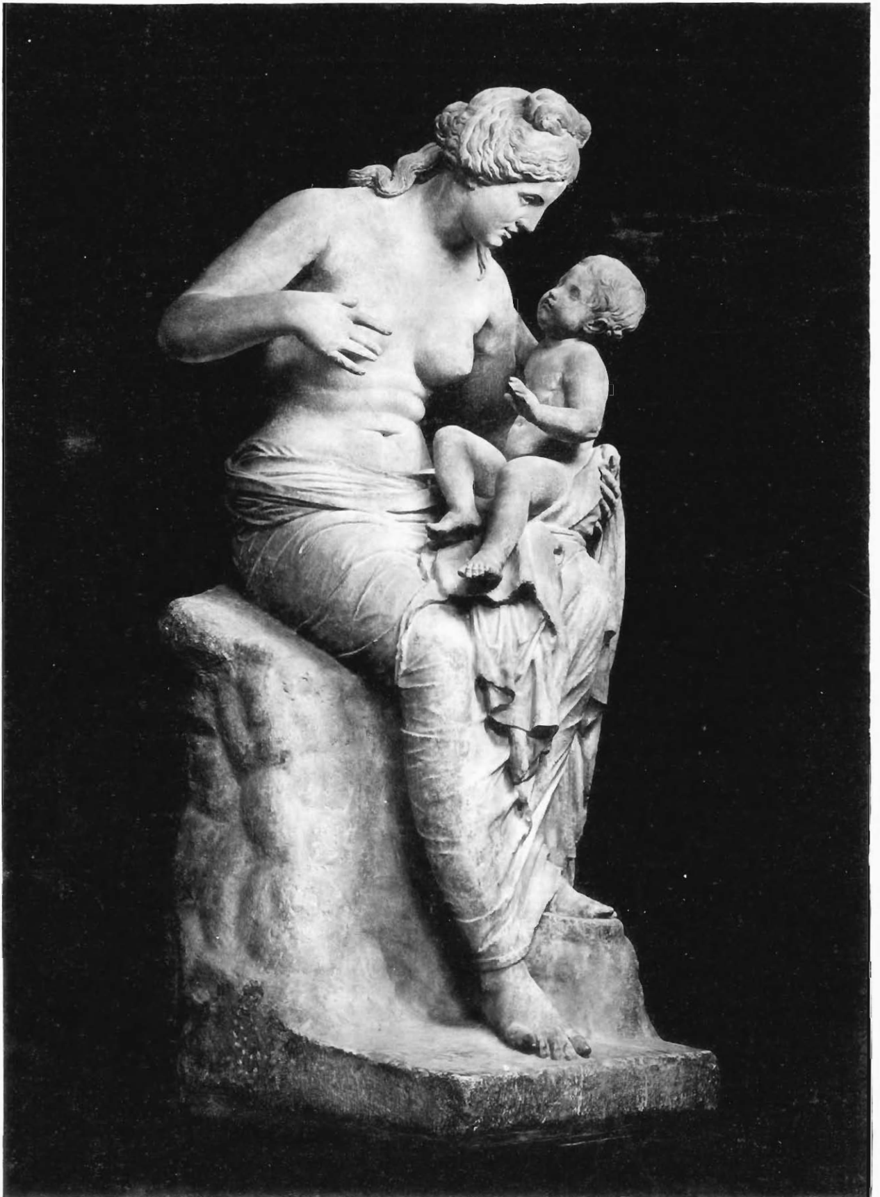
GRUPPO LANTE - La Ninfa Nysa con Dioniso fanciullo