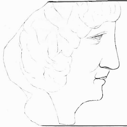
Συβώτης δὲ ὁ Εὐβοιεύς.

Unter den Antiken, welche den Seulenhof des gewaltigen von Michelozzo erbauten Palazzo Riccardi zu Florenz schmückten, zog mich neben dem feinen Jünglingskopf myronischer Kunstrichtung, den ich im Dritten Hallischen Programm veröffentlichte 1 , vor Allem der herrliche Kopf aus griechischem Marmor und von griechischer Arbeit an, welcher in einer wolgelungenen Heliogravüre nach dem Gypsabguss im Archäologischen Museum unserer Universität auf Tafel I zum ersten Mal abbildlich mitgetheilt wird.