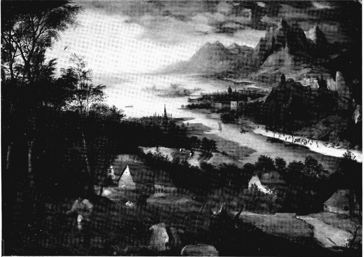
FIG. 1. — ESTUAIRE. (Collection F. Stuyck del Brucyze, à Anvers.)