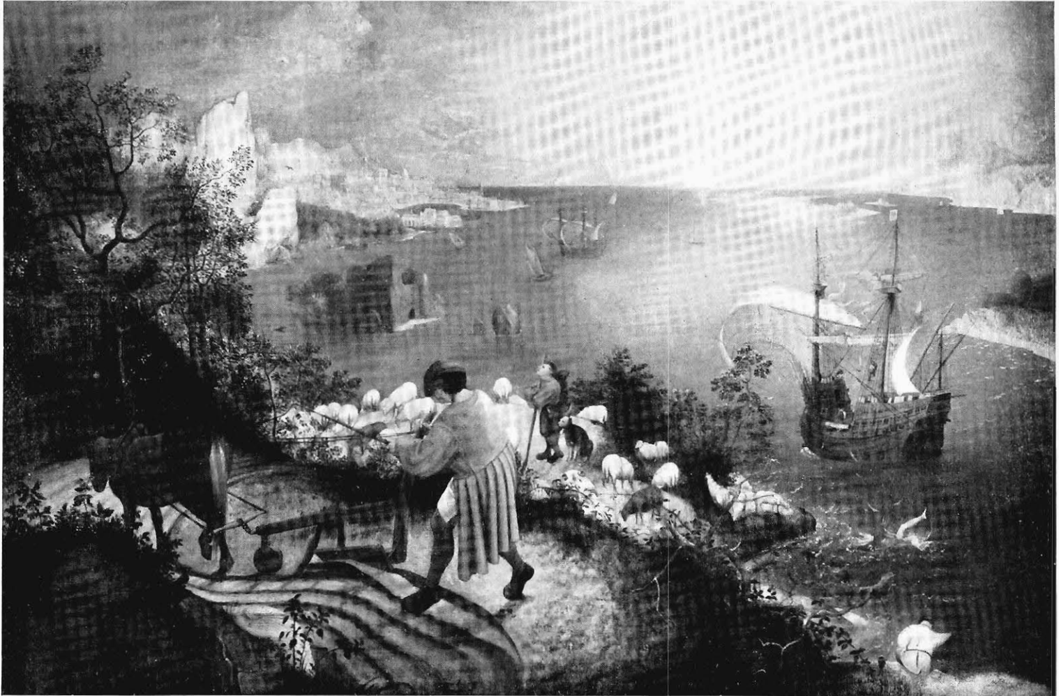
FIG. 2. — CHUTE D'ICARE. (Musée de Bruxelles.)