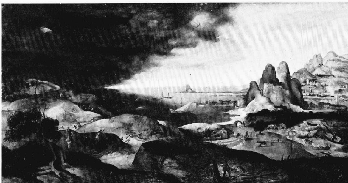
FIG. 3. — PAYSAGE AVEC ÉPISODES DE LA VIE DE SAINTE CATHERINE. (Collection du Dr. Benedict, à Berlin.)

réseau des branches mal charpenté, la façon superficielle d'indiquer les sous-bois avec une buée vaporeuse hâtivement répandue. Le paysan lui-même rappelle, bien qu'en petites dimensions, le laboureur de l'Icare . Les formes des montagnes et des rochers se retrouvent des deux côtés. Aux arrière-plans les constructions des villes, les petits arbres en forme de boules, qui se serrent près des murailles ou parsèment les îles, paraissent copiés les uns sur les autres dans l'Estuaire et dans l'Icare .