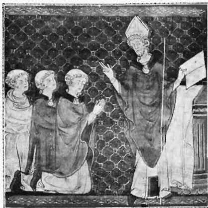
FIG. 2. — HONORÉ. MINIATURE DU « DÉCRET DE GRATIEN » (F° 158 v°).

Décret de Gratien , avec la glose de Barthélemy de Brescia, aujourd'hui conservé à la Bibliothèque de Tours.