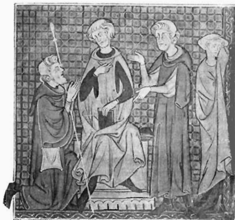
FIG. 10. — HONORÉ. MINIATURE DU « DÉCRET DE GRATIEN » (f° 316).

Qu'elle est ennuyée, cette petite jeune femme de la Question du f° 272 (fig. 6) ; comme ses yeux, sous son petit chapel blanc, dans son exquis petit costume rouge sous son manteau vert, implorent bien le juge ! En effet, elle a cru épouser un jeune homme noble, et voilà qu'elle apprend, trop tard, qu'elle est la femme d'un serf qu'elle n'aurait jamais accepté si elle eût connu sa condition. A-t-elle le droit de demander la nullité du mariage pour épouser un autre ?