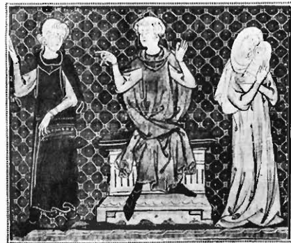
FIG. 7. — HONORÉ. MINIATURE DU « DÉCRET DE GRATIEN » (F° 273 v°).

XIII e siècle. Manuscrit d'une écriture très soignée, vélin, 349 feuillets à 2 colonnes avec gloses marginales, précédés et suivis de deux feuillets de gardes. Titres rouges; 38 miniatures assez finement exécutées, au commencement de la première et de la troisième partie du Décret, et de chaque partie de la