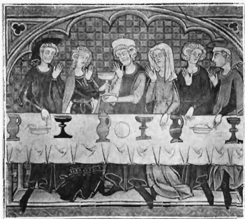
FIG. 11. — HONORÉ. MINIATURE DU « DÉCRET DE GRATIEN » (f° 323 v°).

La Question du f° 262 v° est très grave (fig. 5). Un homme ayant fait vœu de chasteté se marie néanmoins. Sa femme le quitte. Plus tard, le mari au regret vient la chercher. Que doit faire la femme ? Combien amusante est sa petite figure délicate, et comme son air penché annonce bien la réponse négative qu'elle va faire !