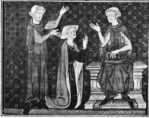
FIG. 6. — HONORÉ. MINIATURE DU « DÉCRET DE GRATIEN » (F° 272).

comme je l'ai fait pour tant d'autres volumes, m'attacher au document lui-même, l'interroger, pour étudier la manière du miniaturiste. Une fois qu'elle sera bien déterminée, nous pourrons, mais alors seulement, poursuivre les recherches et présenter des hypothèses réellement scientifiques.