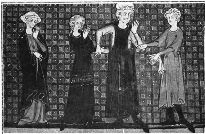
FIG. 8. — HONORÉ. MINIATURE DU « DÉCRET DE GRATIEN » (F o 276).

Le Décret composé par Gratien entre 1139 et 1150, probablement dans le couvent de Saint-Félix, à Bologne,