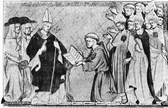
FIG. 13. — MINIATURE DES « MIRACLES DE SAINT LOUIS ». Mss. fr. 5716 de la Bibliothèque nationale (f° 4).

l'aiguillette », nos campagnards l'appellent « mal fait ». Or, au cours du mariage, le mari est frappé d'un « mal fait » : la femme a-t-elle le droit de le quitter ? Bien humainement est ici étudiée la figure déconfite de l'époux, auquel le juge me semble prodiguer d'excellents conseils. Je n'ai pas lu les longues colonnes qui leur sont consacrées, préférant m'arrêter quelques instants à l'une des plus passionnantes propositions du moyen âge (f° 316), qui ont trouvé leur écho jusque dans l'œuvre de Guy de Maupassant (fig. 10). C'est l'éternelle histoire de Martin Guerre, époux de Bertrande de Rols, et d'Arnaud du Tilh, qui fit tant de bruit au xv e siècle, que l'arrêt mémorable de Toulouse, rapporté par Corras, eut sept ou huit éditions. Une femme est l'épouse d'un chevalier qui part pour la guerre. On apprend qu'il est fait prisonnier, puis qu'il est mort. A bout d'un temps convenable, la veuve convole en nouvelles noces.