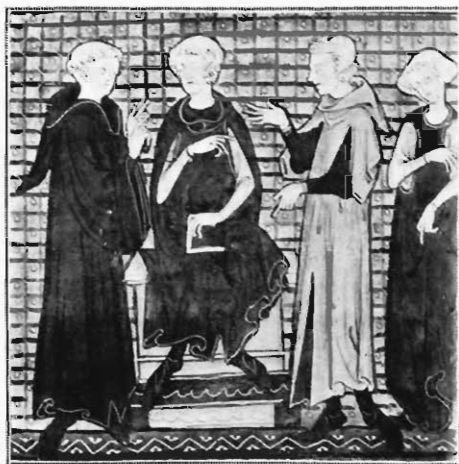
FIG. 3. — HONORÉ. MINIATURE DU « DÉCRET DE GRATIEN » ( f o 262 v o ).

N'était-il pas simple, puisqu'il existe ainsi un manuscrit enluminé, œuvre certaine d'Honoré, de le consulter, avant d'émettre des hypothèses qu'on avoue problématiques ? C'est ce qui n'a pas été fait, car, écrivait tout dernièrement un éminent critique, l'œuvre est demeurée jusqu'ici à peu près inconnue.