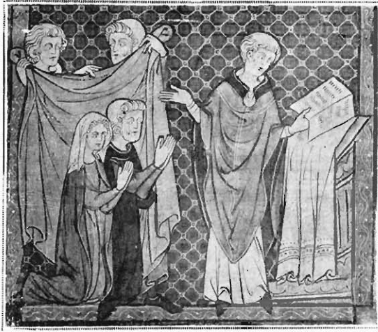
FIG. 9. — HONORÉ. MINIATURE DU « DÉCRET DE GRATIEN » (F° 278).

il est en avance d'un demi-siècle sur les artistes du xiv e , qui vont, sous l'inspiration nouvelle du sentiment profane, abandonner, dans la représentation féminine, la tradition de la gravité pieuse et de la pureté parfaite; c'est donc une personnalité tout à fait intéressante. Et comme aujourd'hui, les noms vont pouvoir devenir des jalons, nécessaires pour préciser les choses que les entités, si séduisantes soient-elles, laissent toujours dans une incertitude facile, nous ne saurions trop mettre en lumière un artiste qui, comme Honoré, marque une étape aussi nouvelle que caractéristique dans l'histoire de l'art.