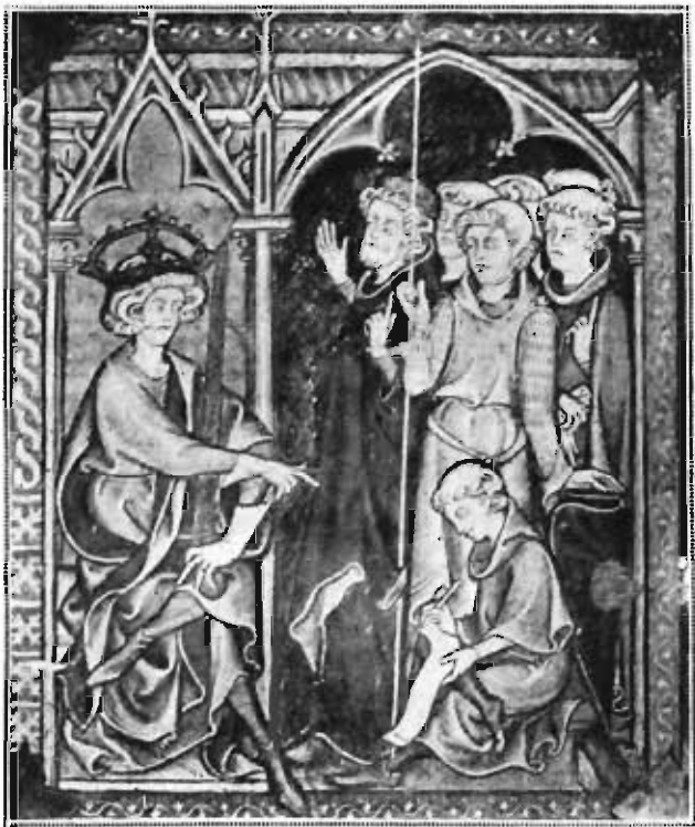
FIG. 1. — HONORÉ. MINIATURE DU « DÉCRET DE GRATIEN » (F° 1). Bibliothèque de Tours.

Le miniaturiste Honoré est certainement un des enlumineurs les plus célèbres du XIII e siècle.