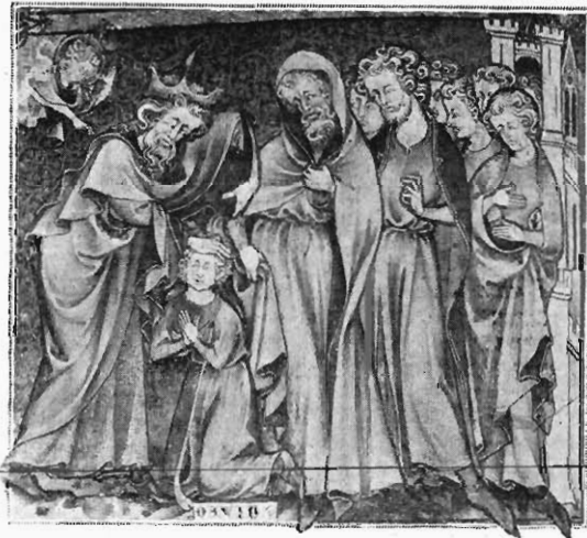
FIG. 15. MINIATURE DU «BRÉVIAIRE DE PHILIPPE LE BEL» (FRONTISPICE).

Blâmera-t-on mon imprudence, si j'attribue à Honoré lui-même cette première miniature des Miracles de saint Louis (ms. fr. 5716 de la Bibliothèque nationale) (fig. 13) ? Les figures reproduites plus haut (notamment les fig. 3 et 4), ne se retrouvent-elles pas dans ce groupe d'évêques du