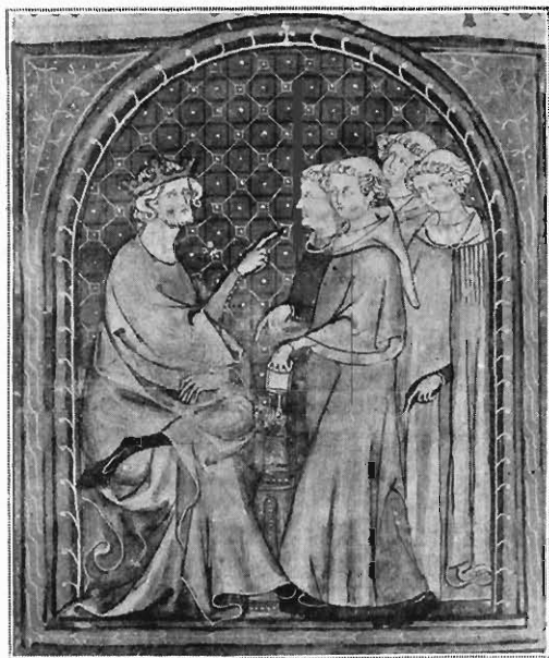
FIG. 14. MINIATURE DE « L'YMAGE DU MONDE ». Mss. fr. 574 de la Bibliothèque nationale (n° 1).

lourdeur germanique du même temps! Telle cette miniature de Conrad de Scheyern, également du XIII e siècle (du Codex lat. 17401 de Munich), que je veux en rapprocher, pour montrer quel fossé profond sépare, à cette date, les deux mentalités artistiques (fig. 12). Certes, Honoré eût fait d'un épisode regrettable de la vie de cette abbesse une page des plus piquantes, les illustrations des cas de conscience de Gratiien nous le certifient,