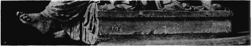
25: Detail zu Fig. 24.

Amelung sprach sich als erster über die Unmöglichkeit der seither ohne weiteres angenommenen Ergänzung aus, welche Overbeck sogar in seine Abbildung einzeichnen ließ, die Voraussetzung nämlich, daß die Füße des Mädchens auf einer vorspringenden Stufe aufgeruht hätten. Unausführbar ist der Zusatz aus dem einfachen Grunde, weil die Chitonfalten tiefer als das durch die rechte Sohle bestimmte Niveau jener vermeintlichen Stufe herabfallen. Freilich läßt sich dieser Einwand vor dem Original heute nicht mehr kontrollieren; man kann sich aber von seiner Berechtigung überzeugen an der Abbildung in den Monumenti Inediti IX 34 und an Photographien, die vor etwa zehn Jahren aufgenommen sind, wie eine solche unserer Abb. 24 und 25 zugrunde liegt. Auch die merkwürdigerweise sehr seltenen Gipsabgüsse genügen als Grundlage zur Beurteilung der folgenden Untersuchungen; wenigstens ergab sich mir schon als Student vor einem Exemplar im Universitätsmuseum zu Straßburg das Wesentliche der hier mit-