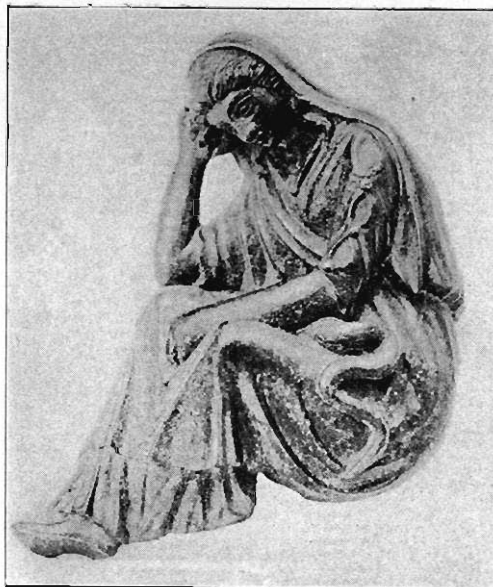
29: Bronzeapplik im Privatbesitz zu Heidelberg.

Im vorausgehenden Aufsätze (S. 43) habe ich nachgewiesen, daß die delphische Prophetin ihre Antwort im Schlaf, in ekstatischem Traume gibt. „Müde, wie aus schwerem Traum erwacht,“ schien uns das in der Barberinischen Statue dargestellte Mädchen und aus ihrem leicht geöffneten Munde glaubt man die nur halb