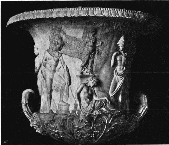
19: Mediceischer Krater. Ergänzungen im Figurenfriese schraffiert.

bleibt Lanzis Angabe, daß der Figur, als die Vase in Florenz ankam, ihr Oberkörper fehlte. Antik kann aber, ganz abgesehen von stilistischen Gründen, das Fragment aus folgender Erwägung nicht sein: Oberkörper und Kopf hängen — mit Ausnahme von einem winzigen Teil des Hinterkopfes — nicht mit der Grund-