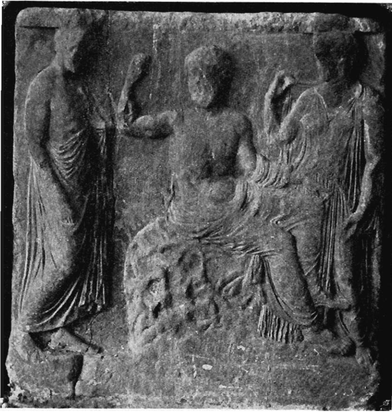
26: Relief aus dem athenischen Asklepieion.

seiner Einführung für Helena und Elektra im Iliupersisbild des Polygnot, wie Vasenbilder und Grabstelen beweisen, recht beliebt. Aber mit einer Toiletten- szene ist das so vernehmliche Pathos im Kopfe ganz unvereinbar. Wir können uns bei dieser Lösung nicht beruhigen.