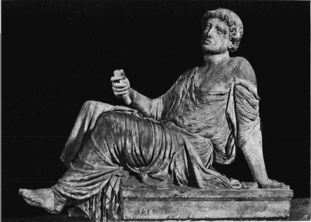
24: Statue der „Schutzlehenden“ im Palazzo Barberini.

Mädchens auf Beziehung zum Kulte chthonischer Mächte schließt, seine Erklärung im einzelnen aber nicht weiter ausführt. Er gibt auch eine genauere, aber noch nicht hinreichend genaue Aufnahme des Befundes an der Statue, welchem jede, auch eine nur ideelle Ergänzung Rechnung zu tragen hat. Erklären können wir eine Statue erst dann, wenn wir wissen, wie sie ursprünglich ausschaute. So selbstverständlich das klingt, so wenig wurde in den bisher veröffentlichten Behandlungen dieser selbstverständlichen Vorbedingung genügt.