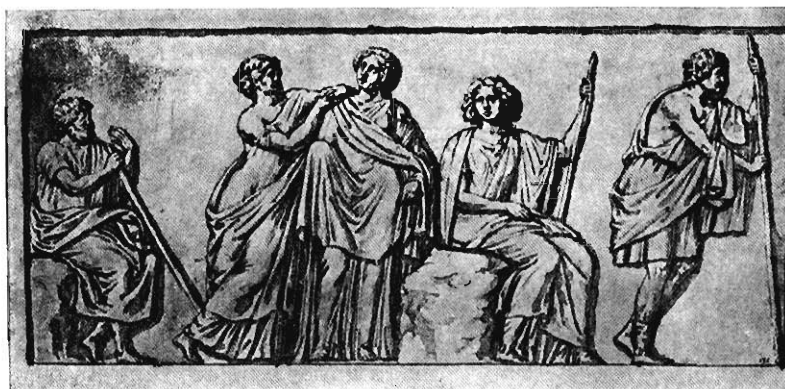
23: Alte Zeichnung eines Friesreliefs.

mit ihm verbundenen Gestalten gibt sich durch irgend ein sprechendes Abzeichen zu erkennen. Die Frauengruppe soll auf dem Puteal wohl Demeter und Kore vorstellen; aber mit ihnen hat ja Aias nichts zu schaffen. Umdeutungen nehmen die Neuattiker bekanntermaßen auf die leichte Schulter; also steckt in dieser Wandlung des Sinnes keinesfalls ein Grund gegen die von mir beim Krater gewählte Benennung.