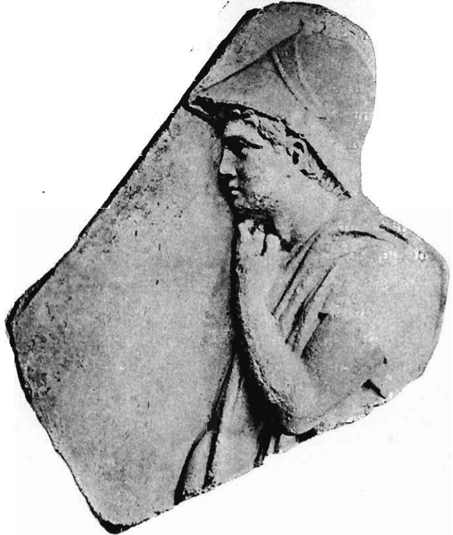
22: Fragment des Mediceischen Kraters nach Fröhner, Collection Gréau 1891 Taf. LXX.

Da in der Vase heute keine Lücke klafft, ließ sich der Abguß natürlich nicht Bruch an Bruch anpassen, dessen Zacken übrigens am Original vom Ergänzner abgeschliffen wurden, so daß nur die Richtung der Bruchlinie in ihren Hauptzügen feststeht. Aber ein nicht zugehöriges Fragment könnte ja unmöglich im Maßstab, in der Darstellung und Bruchlinie so genau übereinstimmen, daß die Linien einander fortsetzen. Schon diese Tatsache genügt, jeden Zweifel auszuschließen. Das Liechtensteinsche Fragment erfüllt überdies eine kompliziertere Bedingung, nämlich die leichte Wölbung des Kraterkelches in vertikaler und horizontaler Richtung mitzumachen. Die Bezeichnung des Marmors am Fragment als parisch, während derselbe am Krater mir und anderen pentelisch schien, kann bei der Unsicherheit in der Bestimmung