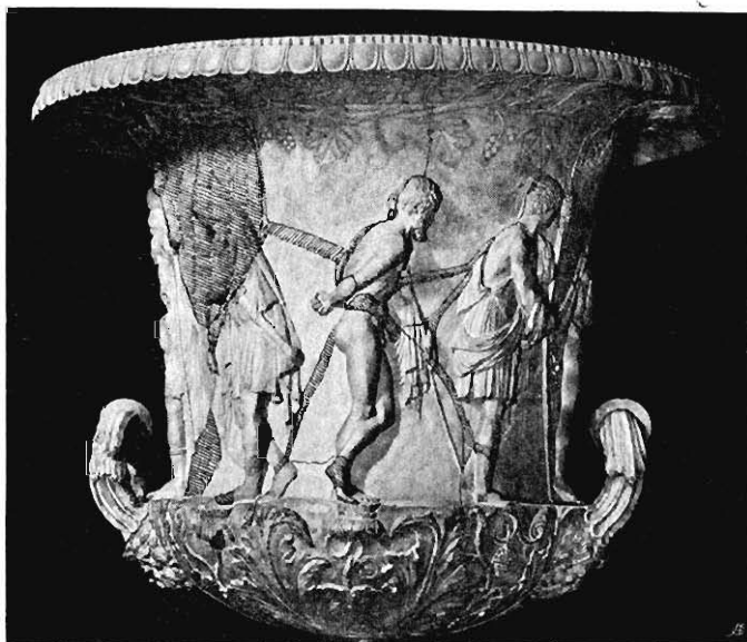
20: Mediceischer Krater.

Auch den Verkaufskatalog der Sammlung Mylius vermochte ich nicht aufzutreiben. Glücklicherweise ließ Froehner das Bruchstück auf Tafel 70 in wirklicher Größe abbilden; wir wiederholen die Publikation verkleinert in unserer Fig. 22. Schon aus dem Lichtdruck war zu erkennen, daß der Kopf mit seinen kurzen Locken weibliches Geschlecht ausschließt; die unleugbare weibliche Weichheit im Gesicht wählte der Künstler nicht zum Zwecke der Charakterisierung, vielmehr charakterisiert sie sein eigenes Schönheitsideal, einen Stil, der mich sofort an die Mediceische Vase gemahnte.