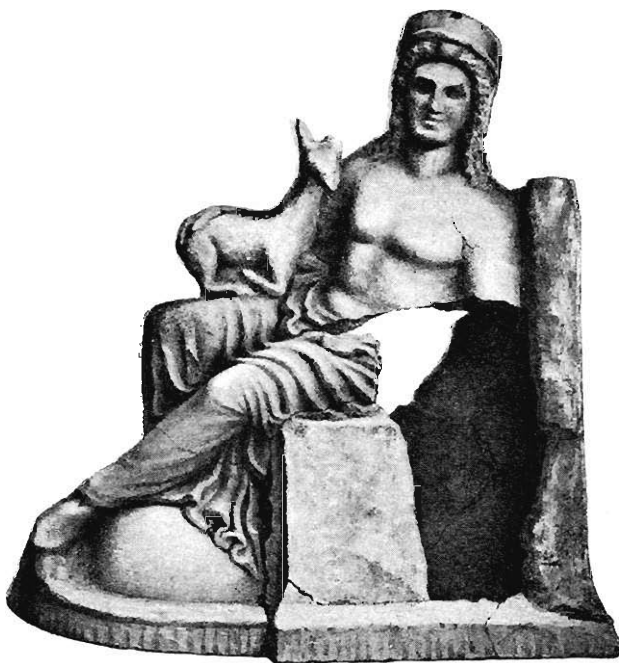
27: Terrakotta von der Halbinsel Taman.

Nach seinem Druck auf den Chiton zu urteilen, war der abgemeißelte Gegen-