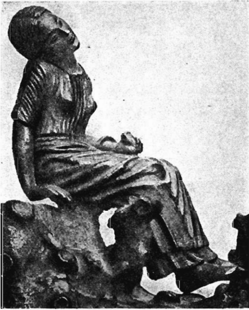
28: Bronzestatuetten im Museo Archeologico in Florenz.

der Schlangen gebissen worden. Das delphische Orakel verleugnet nie seine Geschichte. Wie es Aischylos, Eumenides 1, wußte, so wußte man noch im späten Altertum, daß vor Apollon dort die Erdgöttin und deren Tochter Themis den Orakelsitz innehatten. Schlangen, das am festesten am Boden haftende Lebewesen, verwendet aber die Bildersprache der Dichtung wie der Kunst zum Ausdruck von Beziehungen zur Erde oder zu den Unterirdischen. Wenn also auch bisher nicht monumental belegt, darf die Schlange als bezeichnendes Attribut