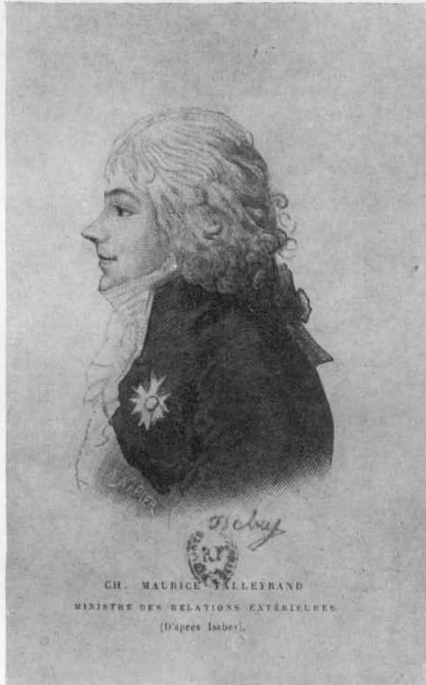
PORTRAIT DE TALLEYRAND GRAVURE D'APRÈS ISABEY

qui seront envoyés à Rome,... et cinq cents manuscrits au choix des mêmes commissaires 1 . » La liste des statues fut dressée par les commissaires dès le mois d'août suivant; elle débute ainsi : « Muséum du Vatican. 1. L'Apollon du Belvédère; 2. Le Laocoon, idem ; 3. Le Lantin, idem 2 . » Ces dépouilles opimes et d'autres « objets de sciences et d'arts recueillis en Italie » firent leur « entrée triomphale » à Paris, lors des fêtes de la Liberté des 9 et 10 thermidor an VI, 27 et 28 juillet 1798. Parti du Muséum d'histoire naturelle, ce défilé extraordinaire, où des animaux exotiques voisinaient avec les chefs-d'œuvre des arts, se rendit au Champ de Mars par les boulevards de la rive gauche; là, il fut reçu par le ministre de l'Intérieur, François de Neufchâteau, entouré des membres de l'Institut. Le treizième char, dans la division des Beaux-Arts, portait « l'Antinoüs égyptien, l'Antinoüs du Belvédère, » c'est-à-dire l'Hermès qui est représenté sur la toile de Greuze 3 .