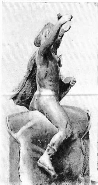
Fig. 3. — Statuette d'Alexandre à cheval (Collection Dattari).

II. Le second portrait d'Alexandre le Grand, acquis par M. Dattari, mérite, bien plus que le précédent, d'être considéré comme une image réaliste du Macédonien; c'est peut-être même, avec le