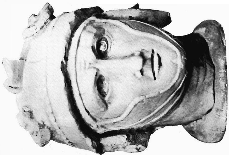
TÊTE EN MARBRE D'ALEXANDRE-LE-GRAND