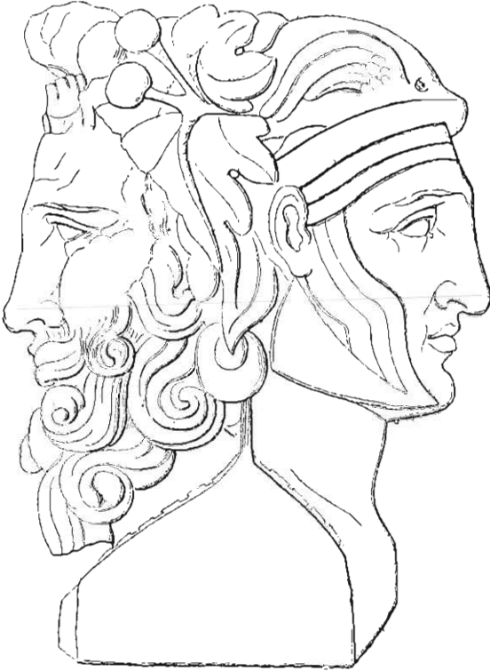
Fig. 6. — Hermès double autrefois à Rome.

Le type d'Alexandre avec les cornes de Zeus Ammon est surtout connu par les monnaies d'Alexandrie, où les cornes sont asso-