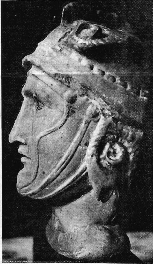
Fig. 1. — Tête d'Alexandre le Grand (Collection Dattari).

La riche collection de M. Dattari, au Caire, s'est accrue en 1904 de deux œuvres très importantes qui sont destinées à tenir un rang élevé dans la série des images d'Alexandre le Grand. Grâce à la libéralité du possesseur et à l'obligeante entremise de M. Joseph Offord, je puis donner aux lecteurs de la Revue la primeur de ces sculptures, qui ont déjà été décrites, mais ne semblent pas avoir été reproduites encore. Je ne connais les originaux que par des photographies et ne puis donc en affirmer directement l'authenticité; toutefois, ils ont été vus par plusieurs connaisseurs très au-