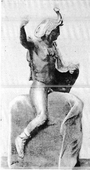
Fig. 2. — Statuette d'Alexandre à cheval (Collection Dattari).

I. Statuette en bronze d'Alexandre combattant à cheval (le cheval manque). J'ai présenté des photographies de ce beau monument à l'Académie des Inscriptions, dans sa séance du 24 février 1905 1 ; M. Rubensohn l'a décrit avec détail dans l' Archaeologischer Anzeiger 2 . La hauteur de la statuette est d'environ 20 centimètres; la provenance indiquée est Athribis dans le Delta.