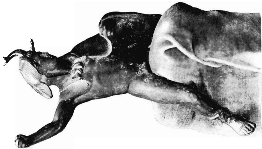
STATUETTE EN BRONZE D'ALEXANDRE LE GRAND (COLLECTION D'ATTARI)