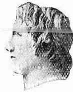
Fig. 5. — Tête de l'Alexandre de Tivoli au Louvre.

répandus, surtout en Égypte, et l'on doit plutôt s'étonner de ne pas en posséder encore un plus grand nombre. Le visage du buste Dattari, d'une conservation irréprochable, offre des traits individuels tout à fait frappants : les yeux un peu rapprochés, le nez long et mince, la faible distance entre le nez et la bouche. L'expression est dure, irritée même ; c'est bien le Pellaeus juvenis