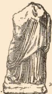
FIG. I. STATUE EN MARBRE, DE TARENTE.

Bien que la céramique occupe la première place au musée de Tarente 1 , la sculpture funéraire y est représentée par quelques spécimens fort intéressants : en effet, si les vases y ont été, pour la plupart, importés de Grèce par les anciens ou d'Apulie par les modernes, les statues et bas-reliefs, découverts tous dans la ville, présentent les caractéristiques d'un art local, révèlent que les potiers italiotes devaient puiser à Tarente la source de certaines représentations, et en précisent enfin la valeur sépulcrale. Pagenstecher, M. Bendinelli, M lle Caianiello, Zancani, ont étudié certaines de ces pièces 2 ; le directeur, M. Quagliati, a bien voulu m'autoriser à en publier quelques autres, qu'un amateur habile et complaisant, M. Harold Vickers, a pris la peine de photographier.