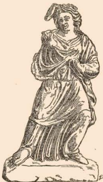
FIG. 2. STATUETTE EN CALCAIRE, DE TARENTE.

Ce n'est pas le seul mythe auquel les sculpteurs tarentins faisaient appel pour leurs statues tombales en ronde-bosse. Saisie aux cheveux par un bras qu'on devine d'après un pan de chlamyde et le trou d'encastrement, une jeune fille (pl. XXIII, 4) 51 cherche en vain à se dégager de la tête