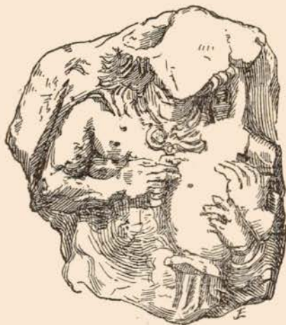
FIG. 5. FRAGMENT EN CALCAIRE, DE TARENTE.

Si ces différents tableaux paraissent évoquer la mort, quelques-uns ouvrent la perspective de la vie future. La transition se fait par les scènes dionysiaques et érotiques, relevées en grand nombre sur les vases de