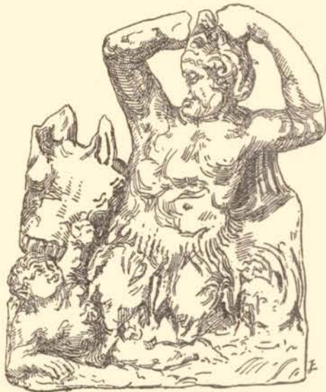
FIG. 3. — BAS-RELIEF EN CALCAIRE, DE TARENTE.

et des jambes, tandis que du bras droit elle semble ramener son vêtement sur sa poitrine, et que du gauche elle enlace un pilastre : ce doit être Cassandre, arrachée par Ajax au Palladium. Je crois la reconnaître encore dans une autre statue en calcaire très voisine (pl. XXIII, 3) 52 , où son sein droit a été mis à nu : c'est ainsi qu'elle figure sur un bas-relief en marbre