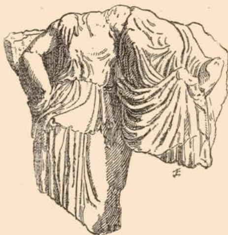
FIG. 4. — BAS-RELIEF EN CALCAIRE, DE TARENTE.

t-on ici les deux mêmes sources d'inspiration, mais les figures symboliques l'emportent sur celles de la réalité. De ces dernières, j'ai déjà signalé la femme au coffret et celle qui se lamente 61 ; une autre est debout sur une plinthe ; deux s'enlacent par l'épaule dans un gracieux mouvement fig. 4 ; une dernière, qui était polychrome, apparaît au milieu de palmettes ; un jeune homme porte un miroir ; trois objets d'offrandes, où l'on reconnaît un miroir et un éventail, s'alignent sur un fragment 62 . Mais les pièces les plus complètes représentent l'une trois éphèbes (pl. XXII, 1), l'autre trois femmes (pl. XXII, 2). M lle Caianiello qui les a publiées 63 a fini par y voir les parties d'une frise considérable offrant « ou la représentation d'une vraie et propre scène de culte à la tombe, ou une scène d'offrandes qu'échangent des vivants ». Elle n'a pas pris garde, en rejetant pour le second fragment l'hypothèse de pleureuses comme « trop commode et trop