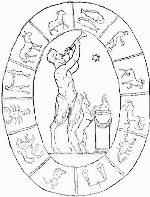
1) Pan inmitten des Zodiacus (nach Müller-Wieseler D. d. a. K. 2, 44, 554).

um den Zodiacus 7 Götterwagen als Symbole der 7 Planeten). Freilich könnte, da Helios oft vom Zodiacus umgeben dargestellt wird, in diesen Fällen auch an die oben (Anm. 18) erwähnte Identificirung des Pan mit dem Sonnengott gedacht werden, doch scheint allerdings gegen diese Annahme der Umstand zu sprechen, dass auf dem zuletzt erwähnten Stein der Zodiacus noch von den Darstellungen der sieben Planeten, zu denen ja auch die Sonne gehört, umgeben ist, so dass man, wenn Pan auch hier die Sonne bedeutete, eine unwahrscheinliche Tautologie annehmen müsste. Uebrigens geht aus denjenigen Zodiacus-Darstellungen, welche einen rein menschlich gebildeten Pan umgeben, mit grosser Wahrscheinlichkeit deren völlige Unabhängigkeit von der stoischen Lehre hervor, welche stets nur den Ziegenpan voraussetzt.