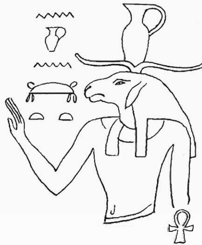
3) Chnum mit der Henkelvase auf dem Haupte (nach Lanzone a. a. O. Tav. 337, 3).

möchten, auf eine weitere höchst merkwürdige Uebereinstimmung, die kaum eine zufällige ist, aufmerksam machen. Wie wir oben sahen, wurde der göttliche Weltordner oder Welterschöpfer in der orphischen Theogonie Protogonos, Zeus und Pan genannt. Eine einfache Erklärung dieser höchst merkwürdigen und sonst unerhörten Identificirung von Zeus und Pan als Weltordner und Urgötter erblicke ich in der Thatsache, dass diese Gleichsetzung von Zeus und Pan schon lange vor der Entstehung der orphischen Gedichte in der ägyptischen Religion vollzogen worden ist, indem Amon (= Zeus) und der Widdergott oder, wie die Griechen ihn aufzu-