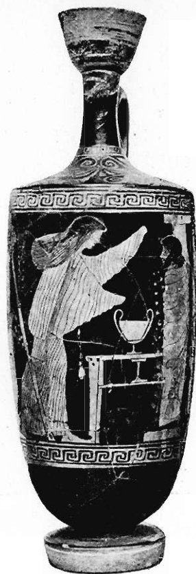
Fig. 9. Bakchantka płsaająca.

Jak dowodzi analogia naczyń, zestawionych i opracowanych przez A. Frickenhaus'a (Lenäenvasen, 72-tes Winckelmannsprogramm, 4 o Berlin 1912, z 5 tabl. i 19 fig. w tekście), w rzekomej głowie Dyonizosa uznać należy jego maskę, którą czasem wtykano na pal, a czasem tylko przytwierdzano do pala, zastępującego resztę postaci. Jest to zatem t. z. Διόνυσος περικλιβνός , czczony w postaci słupa, owiniętego płaszczem i uzupełnionego maską boga. Tenże uczone starał się udowodnić z pomocą tekstów, że wazy odnośnie przedstawiają uroczystość zwaną Lenaiami, podczas której Atenki oddawały cześć starodawnemu idolowi Dyonizosa, wyciosanemu z drzewa i obwieszonemu płaszczem i maską. Prof. K. Robert z Halli (Göttinger Gelehrte Anzeigen VI, 366—373) osądził jednak ujemnie ten