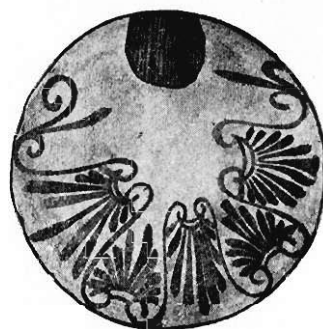
Fig. 13. Ornament na grzbiecie lecyty n. 15.

pendzlem są malowane szaty, których barwa nie jest już pokostowa, lecz matowa, złożona z glinki, łatwo ulegająca starciu i zwietrzeniu.