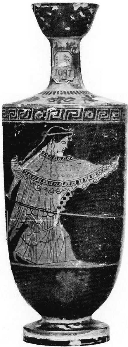
Fig. 7. Atena krocząca do ataku.

Pyszczyk, wargę, ucho i stopka tak samo zabarwione jak u czarnofigurowych. Szyjka zaś i brzusec są całe czarnopokostowane z wyjątkiem obrazu i ram jego, które