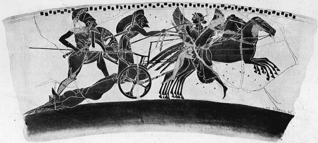
Fig. 1. Achilles włóczący zwłoki Hektora.

Tiré à part de „Sprawozdania Komisji Historji Sztuki t. X, p. 1-30, avec pl. I-II (Comptes Rendues de la Commission d' Histoire de l' Art de l' Acad. Polonaise des Sciences à Craco