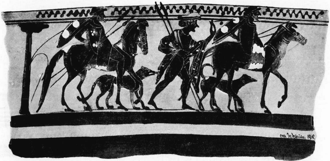
Fig. 3. Jeźdźcy tessalscy ruszają w pole.

fig. 25, tudzież w Museo Gregoriano (Helbig, Führer 3 n. 472) — jeźdźcy tessalscy nie mają tarcz, na krakowskiej lecytce występują z tarczami, co dowodzi, że obok lekkiej kawaleryi była znana ciężka. W pieszym młodzieńcu znać należy giermka (ὕπερέτης, później &μπίπος), którego rzeczą było przede wszystkim dbać o konie i psy i w razie potrzeby pomagać rycerzom konnym przez udział w walce, a przynajmniej przez trzymanie im tarcz i płaszczów, jeśli zsiadłszy z koni walczyli pieszo. Zato, gdy jeźdźcom przyszło pędzić naprzód lub rejterować tak, że niepodobna im było nadążyć pieszo, giermkowie siadali po za nimi na zadach końskich. Nadto dowiadujemy się z krakowskiej lecyty, że tak jak jeźdźcom z Magnezji małoazyatyckiej, także tessalskiej kawaleryi to-