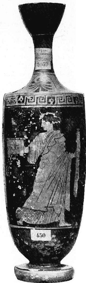
Fig. 11. Lecyta z kobietą kroczącą.