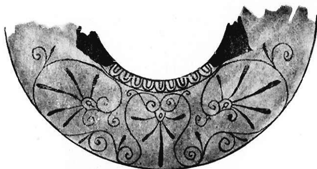
Fig. 12. Ornament na grzbiecie lecyty n. 14.

Podobnie błyszczącą, szklistą plamę tworzą włosy obu postaci. I one są farbą pokostową założone, tylko że do tego celu służyło nie piórko, lecz pendzlik. Również