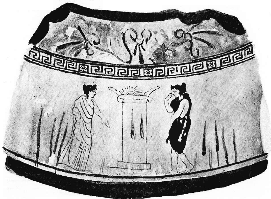
Fig. 15. Dwie kobiety modlące się przy grobie.

16) Czartor. 1255; w. 0'295; o. 0'27. — Pochodzenie jak przy n. 14. — Wymiarami i ogólną dekoracją tak zbliżona do poprzedniej, że mogłaby uchodzić za jej bliźnią, gdyby nie to, że stylem i techniką jest lepsza. Stopka w kierunku grubości jest