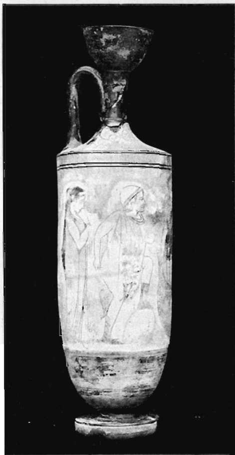
Fig. 16. Hermes przyprowadzający dwie nieboszczki Charonowi.

Obrazek (0.185 X 0.28) jest zamknięty u góry blado różowym meandrem między czterema okalającymi liniami z ciemno brązowego pokostu (tabl. II). Kontury figur są