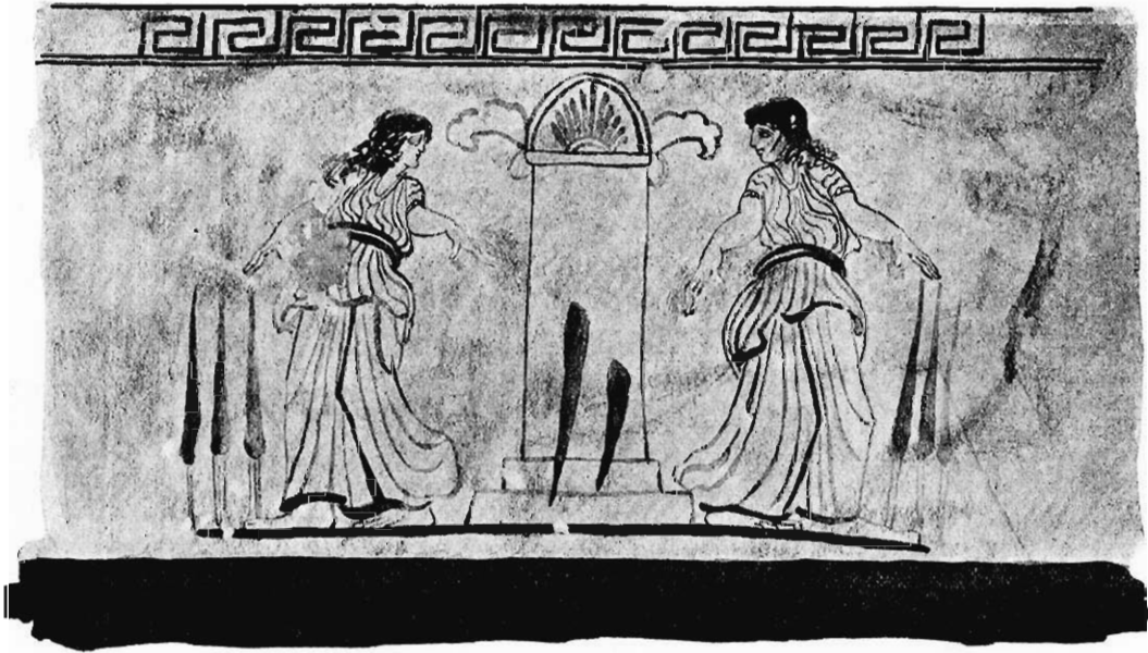
Fig. 14. Dwie kobiety łęgnące się z grobowcem.

włos, pasek, którym chitony a raczej ich zakładki są przepasane, dalej rąbki szat są ciemnobrunatne. Natomiast kontury steli nagrobkowej wraz z liśćmi akantu, obie wstęgi na steli i liście szuwaru są czerwone. — Pod względem techniki malarskiej lecyta przedstawia się zatem jako nieśmiały krok naprzód od malowania farbą pokostową ku polichromii, od piórka czy ostrego pendzelka ku pędzlowi miękkiemu, szerszemu. Niestety pod względem rysunku obrazek pozostawia wiele do życzenia i okazuje się utworem rzemieślniczym. Ramiona kobiet wykręcone jak pletwy, ręce i stopy nieproporcjonalnie wielkie i bardzo fałszywie narysowane. Co prawda, na oryginale i fotografii mniej rażą, niż przeniesione na płaski rysunek. Skutkiem bowiem obłości brzuśca uchy-