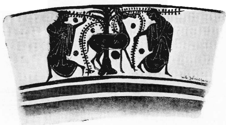
Fig. 6. Dziewczynki łapiące sarnę w ogrodzie.

czzerwony. Drugi koń, z wysuniętą naprzód i pochyloną głową, miał grzywę i ogon biały. Dzisiaj ta barwa się wykruszyła. Plama nad głową trzeciego konia nie jest przypadkowa, lecz pochodzi z zamierzonego, ale nie wykonanego tyrsu, który trzymał Dyonizos w lewej ręce. Przed końmi kroczy, odwracając górną część ciała wraz z głową, Sylen, który trzyma w obu rękach lejce. Ogon jego, broda i włos, były niegdyś czerwonym kolorem podkreślone. Sądząc z poważnej powierzchowności kobiet towarzyszących Dyonizosowi, nie są to Nimfy, ale boginie, a więc wsiadająca na rydwan — może matka jego Semele, a trzymająca gałązki bluszczu, to żona jego Aryadna. W takim razie mielibyśmy na naszym obrazku fragment pochodu bogów, jadących na wesele Peleusa z Tetydą, czy też samego Zeusa z Herą. A więc znowu aluzja do obchodu weselnego,