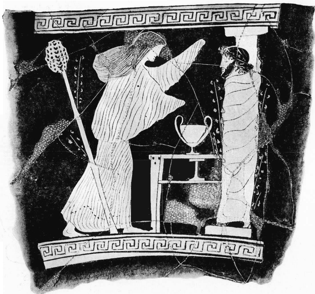
Fig. 10. Bakchantka przed wizerunkiem Dyonizosa.

domysł i usiłował dowieść, że zarówno na naczyniach, jak i w początkowych ustępach Lizystraty chodzi nie o uroczystość publiczną, jaką były Lenaia, ale prywatną. Wedle niego są tu przedstawione tak zwane Jobakcheia, odprawiane w świątyni Dyonizosa, Bakcheionie przed bałwanem bożka z przydomkiem Orthos, a jedyny raz tylko wzmian-