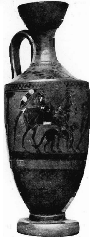
Fig. 2. Lecyta czarnofigurowa.