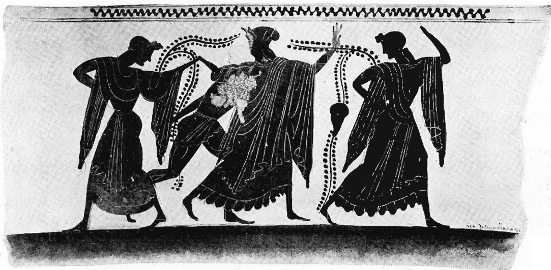
Fig. 4. Zapasy Peleusa z Tetydą.

3) Czartor. 1452; w. 0'32, o. 0'39. — Szyjka i ucho przyklejone. Samo naczynie niepęknięte, tylko powyżej i poniżej prawego ramienia środkowej postaci uszkodzone i w ten sposób odrestaurowane, że odnawiacz najpierw oblepił tę część warstwą kredy czy gipsu i na nim domalował brakujące szczegóły; z nich twarz kobiety dotąd trzyma się (w międzyczasie także oderwała się), ale poniżej ramienia farba w dwóch miejscach odpadła i odsłoniła glinę naczynia. Partye przemalowane są na załączonej rycinie (fig. 4) wykreskowane, uzupełnienia zaś są wypunktowane.