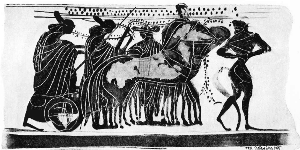
Fig. 5. Wyjazd orszaku Dyonizosa.

Wyjazd orszaku czy rodziny Dyonizosa na rydwanie czworokonnym (fig. 5). Po lewej stronie postać kobieca w długim himatyonie, z warkoczem podwią-