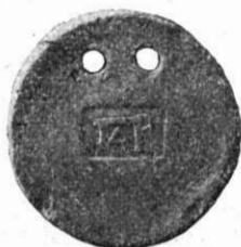
Fig. 2. — Étiquette de Tarente. (Musée de Trieste.)

se manifeste encore dans la même ville et à la même époque sur des disques de terre cuite marqués : \text{H}\Lambda\Lambda\Sigma , \text{H}\text{H}(\text{P})\Delta\text{K}\Lambda\text{H}(\text{T})\text{O}\Sigma , \text{O}\Delta\text{M}\text{M}\text{Y}\Sigma , \text{T}\text{P}\text{I}\text{T}\Lambda\text{I}\Lambda , et la transition d'une forme à l'autre se marque sur un groupe qui ne porte d'autre inscription que \text{M}\text{P}\Lambda\Gamma , \text{P}\Delta\Gamma , ou... \Gamma\Lambda\text{P} (fig. 2) 3 .