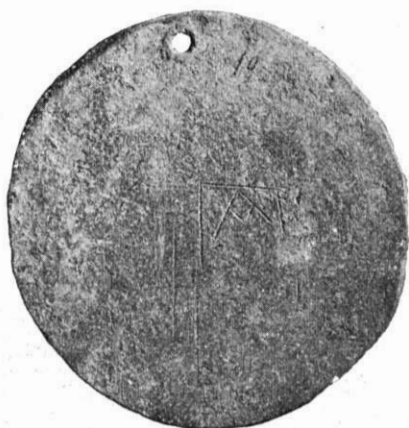
Fig. 1. — Disque mystique de Tarente (revers). (Collection Vlasto.)

dans le dernier quart du III e siècle, Holleaux, vers 221 1 . Or, sans sortir de Tarente, on la voit apparaître déjà entre 302 et 281 dans deux monogrammes monétaires, \Lambda\text{P} et \Lambda\Gamma\Lambda 2 , et y alterner ensuite avec la barre droite, parfois sur des pièces de type semblable. Il y a plus : cette alternance