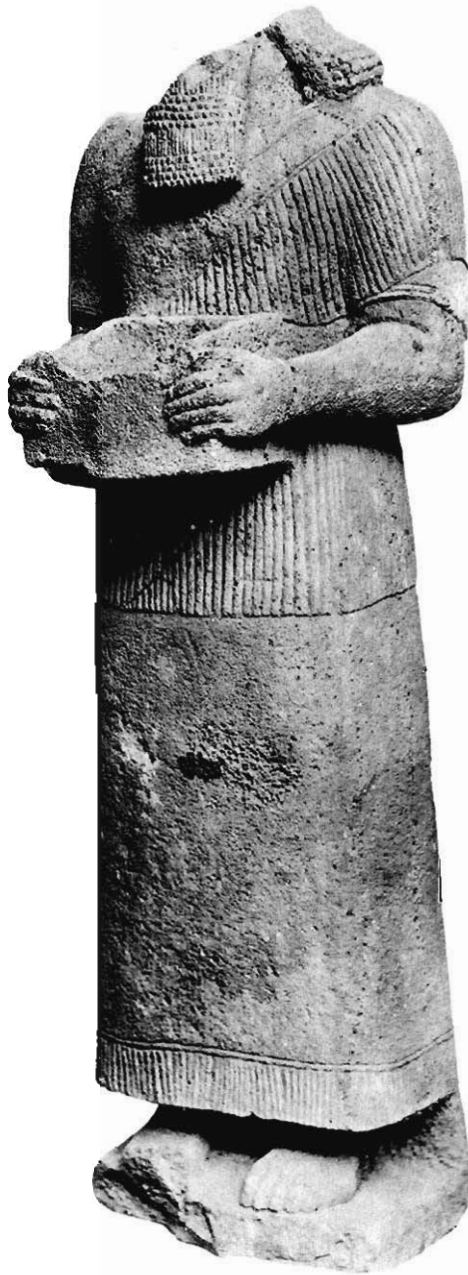
La statue de Métellé (Don du Colonel Normand au Musée du Louvre)