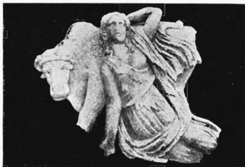
Abb. 6. Kleine Marmorgruppe Rom, Via Margutta

bellt, um ihn zurückhalten zu helfen. Seinesgleichen und andere Tiere wirken ja auch im pergamenischen Gigantenkampfe mit den Herren zusammen. Seine künstlerische Notwendigkeit wird sich uns später herausstellen.