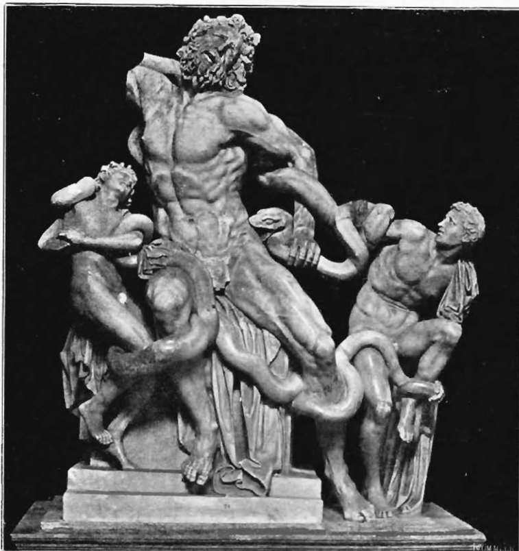
Abb. 7. Laokoon ohne die Ergänzungen

Schon der Hauptgegenstand der Plastik, der Menschenleib, ist kein Körper in stereometrischem Sinne, kein »Mal«, sondern ein organisch tektonisches System von mannigfach geformten, beweglichen Teilkörpern, ein lebendiger Mechanismus. Dieser Mechanismus vermag sich zeitweilig zu erweitern durch äusserlich