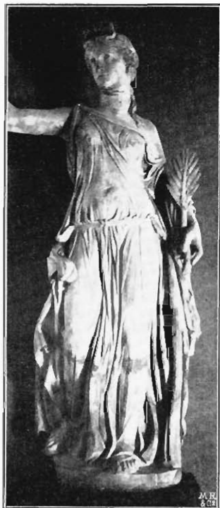
Abb. 5. Statue der Uffizien, Florenz

Der Abhang hinter Amphion und dem Stier ist, als Hypotenuse die dreieckige Standfläche der Figurantin abschneidend (Abb. 4), unverkennbar ein Rest des einstigen hinteren Plinthenrandes, auf den die Blickrichtung der Hauptansicht ungefähr im rechten Winkel trifft. Und vorne geht ihm parallel die Bodenstufe, worauf Dirke sitzt (Abb. 13). Ihre ursprüngliche Fortsetzung nach rechts bezeichnet die Gewandpartie, die jetzt so unwahrscheinlich zufällig über die runde Ciste herabhängt und deren aufdringlich detailliertes Flechtwerk nach dem richtigen Standpunkte hin gänzlich verbirgt. — Dass auch