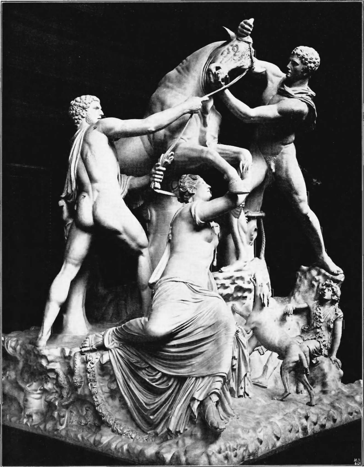
Abb. 13. Der Farnesische Stier, Hauptansicht der ursprünglichen Komposition