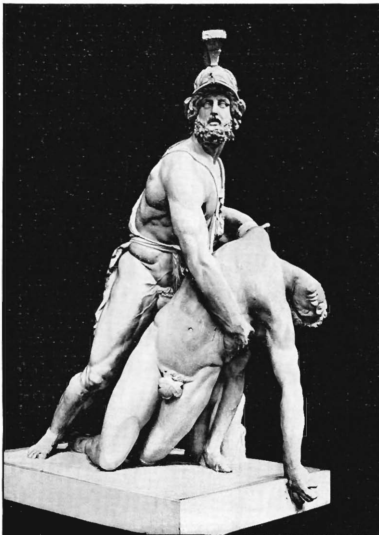
Abb. 8. Menelaos und Patroklos, Abguss des Marmers in Loggia dei Lanzi in Florenz mit richtig gewandtem Kopfe, Dresden

dachten Theorie allen historisch bedeutenden Erscheinungen, einschliesslich des Apoxyomenos, entspricht, kann hier dahingestellt bleiben. Für die statuarischen Gruppen des Altertums gilt sie wenigstens insofern, als diese, wie schon oben (S. 172 l.) gesagt ist, so gut wie durchweg auf eine alles gegenständlich Wesentliche in klarster Ausprägung für einen Blick zusammenfassende Hauptansicht angelegt sind, mögen sie nach der dritten Dimension in reliefmässiger Flachheit beharren, wie der Laokoon (Abb. 7), oder durch grösstmögliche Tiefenentfaltung mehrere lehrreiche und reizvolle Nebenansichten darbieten, wie Menelaos mit der Leiche des Patroklos. Für dieses Wunderwerk nachlysippischer Gruppenbildung, das uns erst Ihre Rekonstruktion, obschon noch nicht ganz abgeschlossen, recht kennen gelehrt hat, sei hier die Vorherrschaft der Hauptansicht (Abb. 8) durch deren Zusammenstellung mit zwei weiteren, abermals Ihrer Güte verdankten Aufnahmen (Abb. 9. 10) anschaulich dargethan 43) .