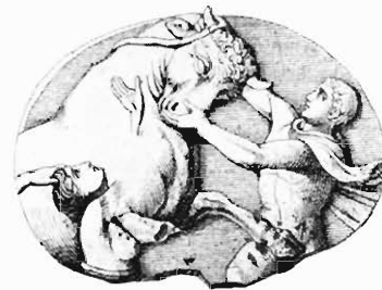
Abb. 12. Camee in Neapel