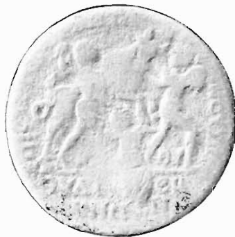
Abb. 11. Münze von Thyateira

50) Br. Sauer in den Mitt. d. d. archäol. Instit. Athen XI, 1891, S. 73 und die sog. carreysche Zeichnung Collignon a. a. O. II, S. 36 oder Kunstgeschichte in Bildern I, Taf. 44, 2.