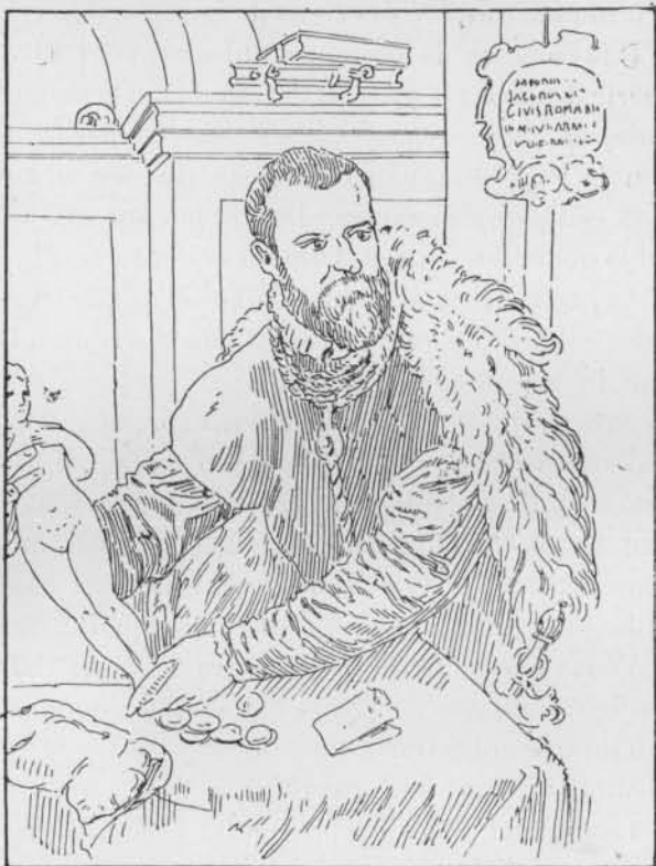
Fig. 4. — Titien. Portrait de J. Strada. Musée de Vienne.

Dans la galerie de l'Ermitage (n° 89), on voit le portrait d'un jeune homme à mi-corps, d'un style influencé à la fois par Giorgione et par Raphaël; dans le lointain, à droite, est une