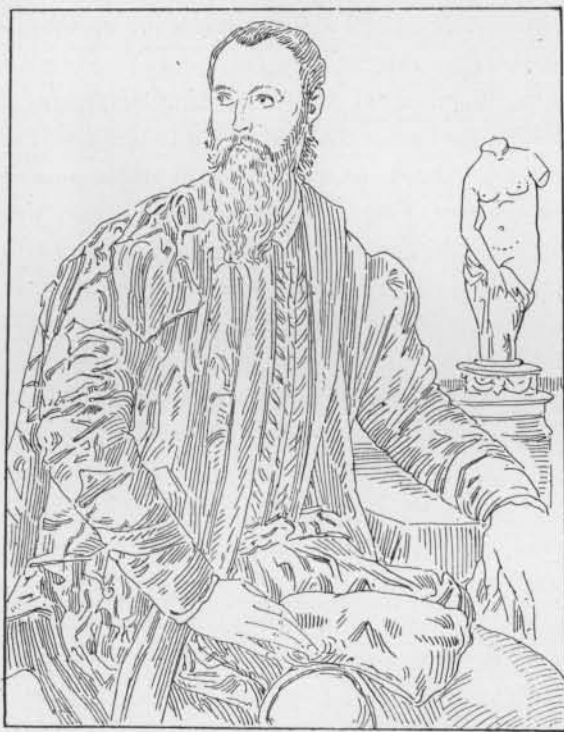
Fig. 1 - Bronzino. Portrait d'un amateur. Coll. Edouard Simon.

ingénieur fontainier ou tout autre. Des deux portraits où l'on a quelque raison de reconnaître Jean de Boulogne — la peinture de Jacopo da Ponte et le buste attribué à Pietro Tacca 1 — le second est celui d'un octogénaire à longue barbe, le premier celui d'un homme d'âge mûr qui n'offre qu'une ressemblance très générale et vague avec le modèle du portrait de Douai. Con-