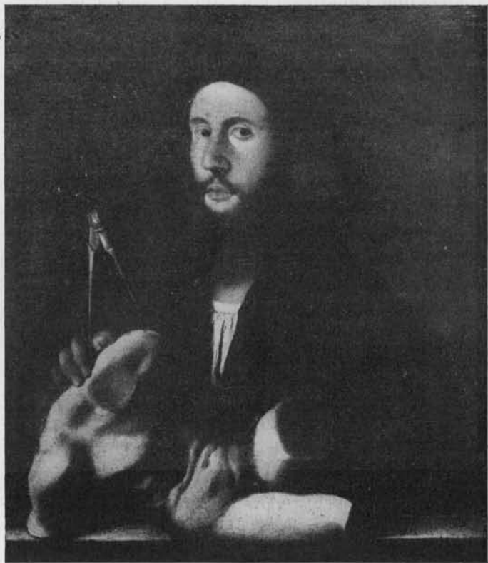
Fig. 3. — École vénitienne vers 1510. Portrait d'un amateur. Collection Lansdowne.

très indistincte sur la photographie. Cornelius Visscher, qui a gravé ce tableau au XVII e siècle alors qu'il appartenait à la collection Reynst d'Amsterdam, a interprété cette figure comme un Hercule meiens , tenant la massue sur son épaule ; l'étude