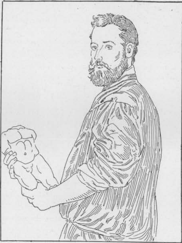
Fig. 5. — G.-B. Moroni. Portrait d'un amateur. Musée de Vienne.

Gian Battista Moroni, de Bergame, appartient aussi, par son éducation et son style, à l'école vénitienne. Le Musée de Vienne (n° 216) possède de lui un beau portrait à mi-corps, représentant un homme vu de trois quarts qui tient des deux mains un petit