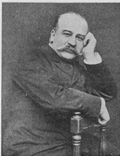
Fig. 6. — Alexandre LACASSAGNE (1848-1924).