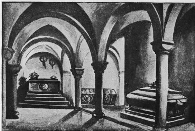
LA CRYPTÉ DU WAWEL