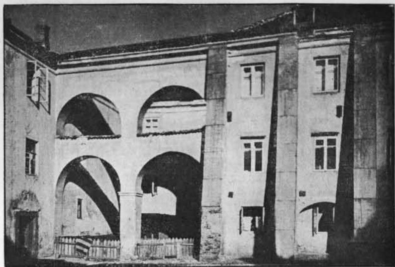
L'UNIVERSITÉ DE WILNO