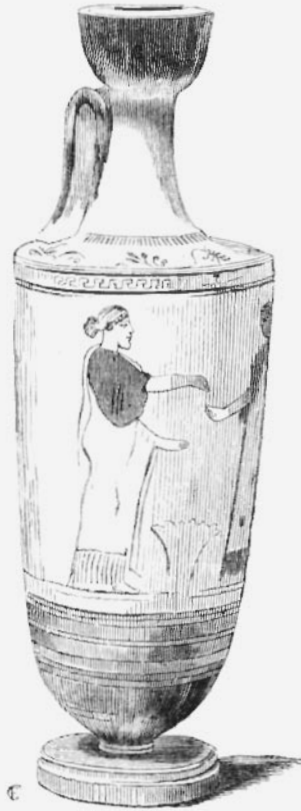
LECYTHUS TROUVÉ A ATHÈNES.

pour le tissage d'une étoffe? Rappelons-nous ce que nous avons dit ailleurs 1 : que plus l'étude des vases fait de progrès, plus on est porté à reconnaître que le plus grand nombre des sujets se rattachent aux idées religieuses et mythologiques. Les scènes les plus vulgaires en appa-