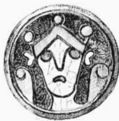
N o 93