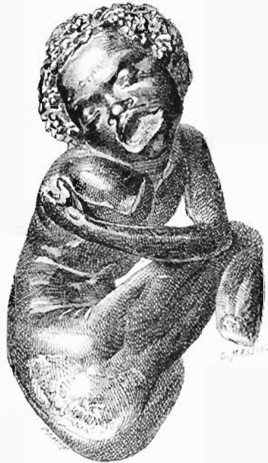
N o 114