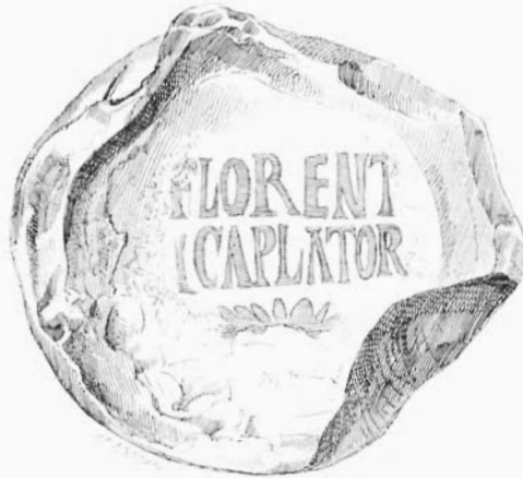
N o 90

88 Fragment de verre chrétien, portant les lettres TE en or sur fond bleu.