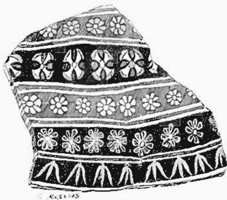
N o 85